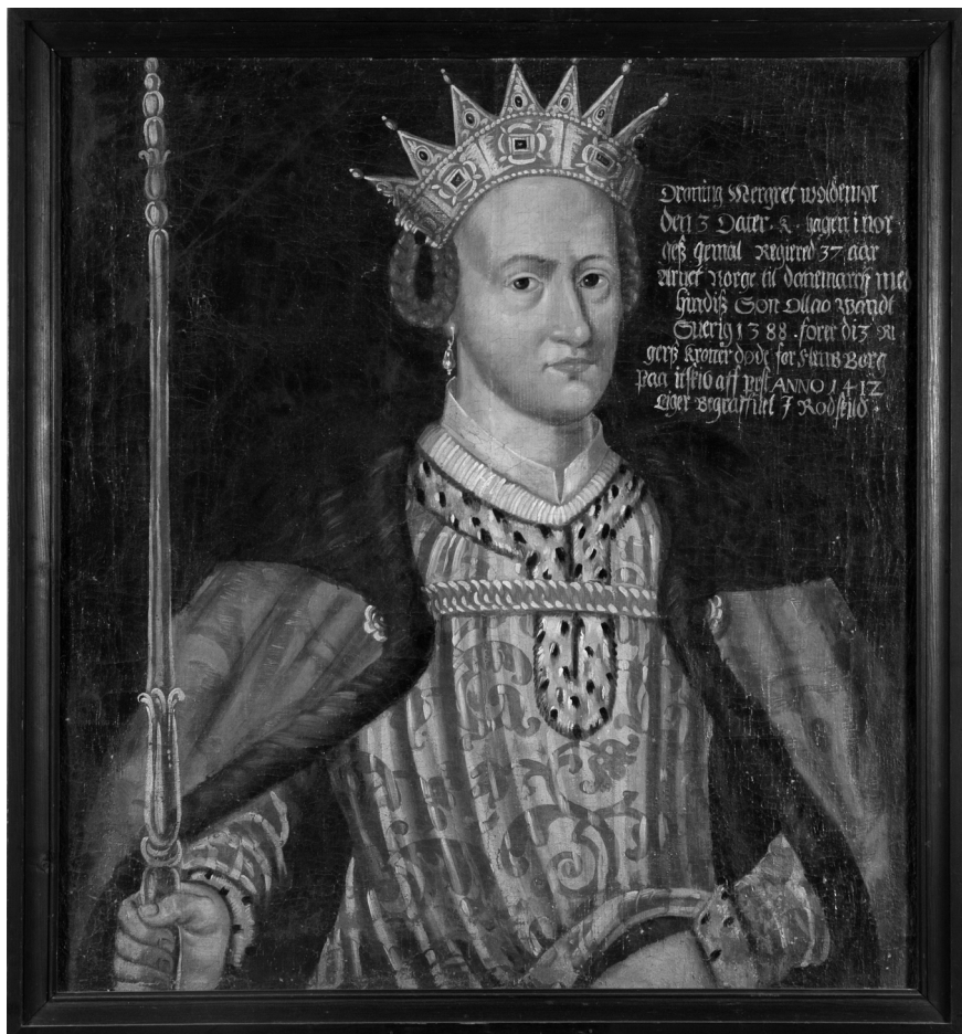
Fig. 2: Drottning Margareta. Porträtt av okänd konstnär. Nationalmuseum, Stockholm. Wikimedia Commons.

utseendet. Några uppgifter om hur Margareta såg ut än mindre hur hon uppfattade sig själv finns inte. Istället har eftervärlden likt Arngrim Berserk litat till sin inbillningsförmåga och då har drottningen avporträtterats med en manhaftig och barsk uppsyn som i porträttet nedan av en okänd konstnär, förmodligen från 1600-talet.