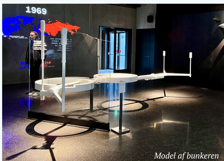
Model af bunkeren

Bunkeren har gennem alle år kun været benyttet til øvelser. Fra 2003 til 2012 faldt den i en form for Tornerose-søvn, som den dog med ganske kort varsel ville kunne vækkes til live fra.