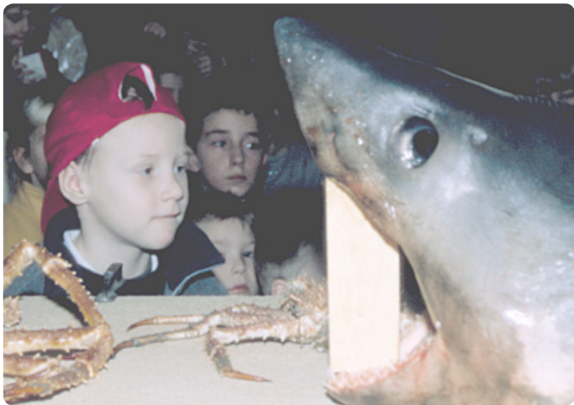
Et kik i dødens gab.

Fiskemanden, som skar hajen ud, henviste til forbindelsen mellem den aktuelle haj og Niels Stensen, som museet er opkaldt efter. Det var jo netop på grundlag af