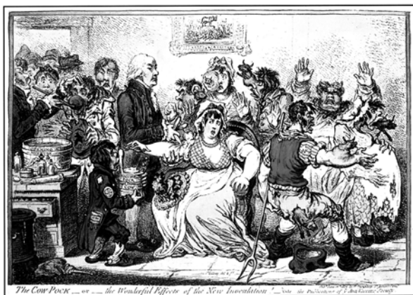
"The Cow-Pock... or... the Wonderful Effects of the New Inoculation!" Coloured etching by J Gillray, 1802.

Frederik VI lovgav omkring vaccination, således