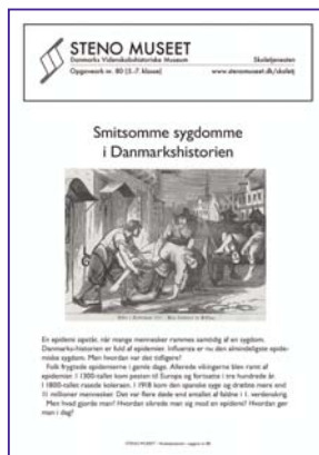
Forsiden på et af de omtalte skoleark.

års fødselsdag. Det skyldtes bl.a. lokale husmodertraditioner, som betød, at spædbørn fik voksenmad fra de var få uger gamle. Såkaldt "Tyggemad", hvor moderen eller tjenestepigen først tyggede maden i munden, var almindeligt. Dette medførte, at mave-tarminfektioner som "Kolerine", også kaldet børnekolera, var meget udbredte og en af årsagerne til, at så mange spædbørn gik til i 1800-tallets danske samfund. Først med bakteriologi og hygiejnens gennembrud omkring 1900 blev amning og kun amning en al-