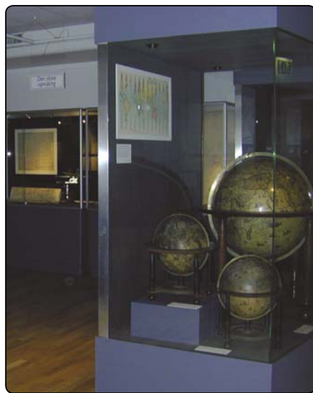
24 timer før åbningen: kaos råder – 1 minut før åbningen: orden og æstetik.