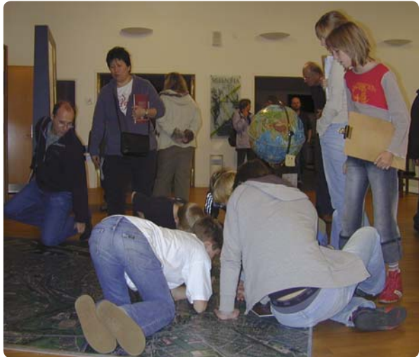
Det populære foto af Århus fra luften.