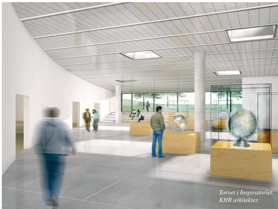
Torvet i Inspiratoriet. KHR arkitekter.