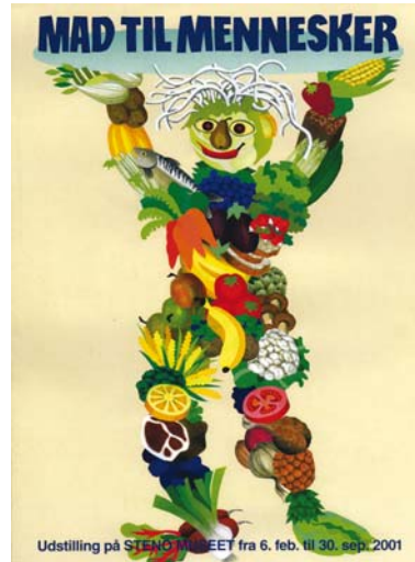
Plakat med fint blikfang. Fra Museets særudstilling 2001.

også indeholde en tekst med medlemsfordelene.