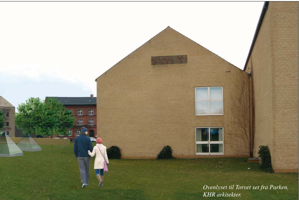
Ovenlyset til Torvet set fra Parken. KHR arkitekter.

Det forventes, at byggeriet går i gang i marts 2006 og vil være færdigt i sommeren 2007. Derefter kan monteringen af udstillingerne påbegyndes, således at INSPIRATORIET kan slå dørene op i 2008. Hermed åbnes et kraftcenter for videnskabskommunikation til glæde for byens borgere, gæster, turister og ikke mindst for børn og unge under uddannelse. kmp