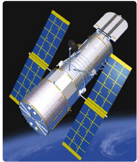
Rumteleskopet. (Tegning: NASA)

Kort tid efter opsendelsen opdagede man, at teleskopet, på trods af fremragende billeder, ikke kunne stilles helt skarpt. En menneskelig fejl ved slibningen af hovedspejlet havde forårsaget en "byggningsfejl". Men lige som vi kan korrigere sådanne fejl ved hjælp af briller, fik rumteleskopet også monteret en "brille" ved det første servicebesøg, hvor astronauter fra rumfærgen skiftede dele ud og gav hele rumteleskopet et serviceeftersyn. Det har teleskopet fået flere gange si-