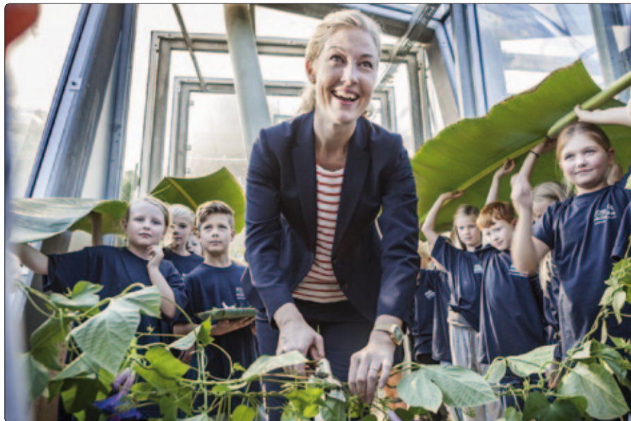
Uddannelses- og forskningsminister Sofie Carsten Nielsen åbnede Væksthusene sammen med 3.b fra Hvinningdalskolen.

rundt omkring i verden. Ad små stier kan man komme helt tæt på planterne og opleve dufte og farver. I tropehuset flakser sommerfugle omkring, piratfisk svømmer i dammen, og man kan høre en mangfoldighed af andre lyde i regnskoven. Lydene kommer bl.a. fra omkring 40 højtalere, der er installeret rundt mellem planterne. På den måde skabes en illusion af, at dyrene bevæger sig rundt i regnskoven. Den avancerede lydkulisse er udviklet i samarbejde med forskere fra Center for Avanceret Visualisering og Interaktion ved Aarhus Universitet.