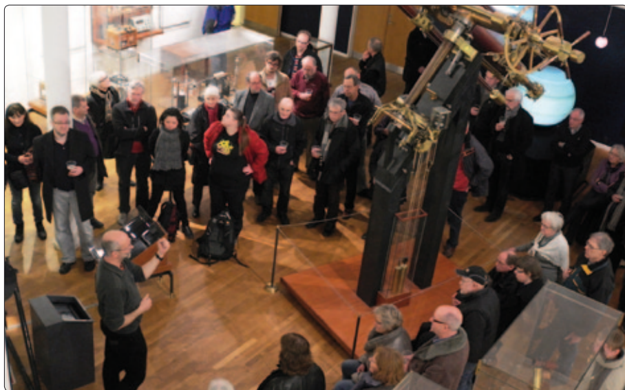
Der er ofte mange interesserede tilhørere til fortællingerne i NatCafeen.