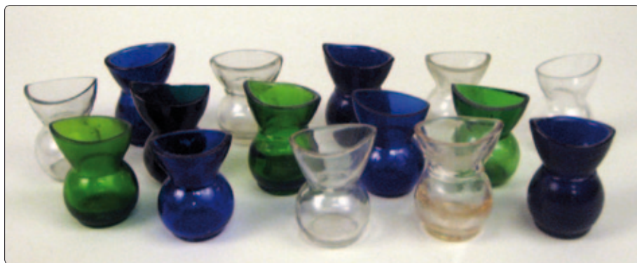
Et lille udvalg af de 169 øjenbade-glas, som i øjeblikket kan ses i Steno Museets foyer.