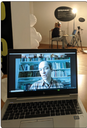
Salen med udstillingen Kære krop, svære krop var omdannet til et digitalt studie i Uge Sex.

Hvert år i Uge Sex vrimler det med unge mennesker på Steno Museet. Særligt i udstillingen Kære krop, svære krop , hvor det flotte, røde centermøbel er fyldt med lange lemmer, gode grin, refleksion og unge stemmer. Det er udskolingsklasser på besøg, og de drøfter kroppe og kropsidealer med hinanden og vores formidlere. Sådan var det bare ikke i år.