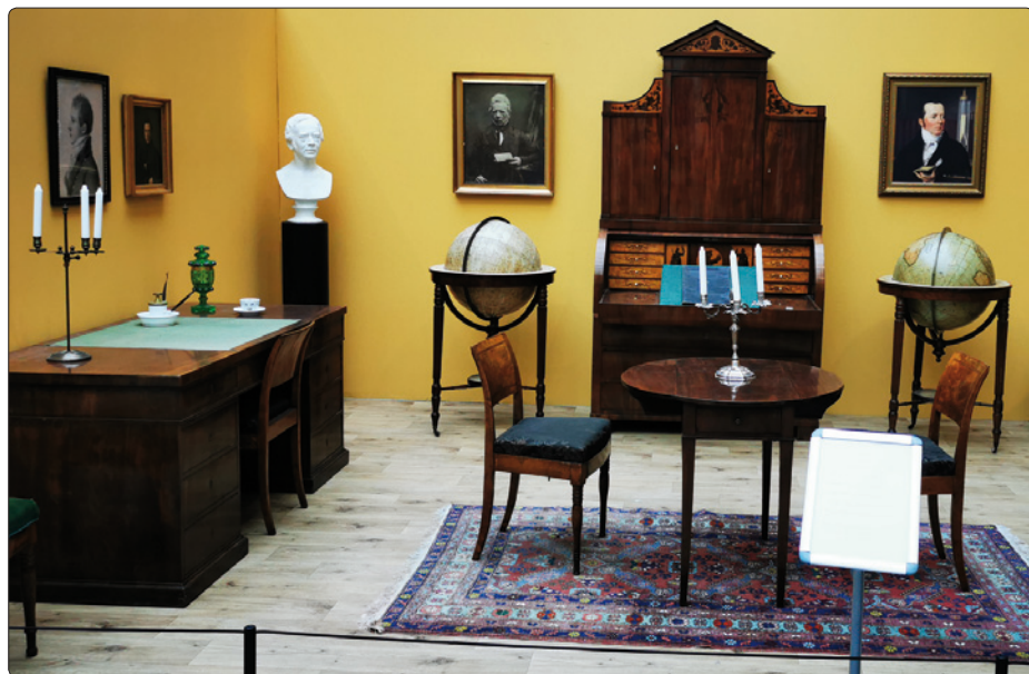
Et guldalderhjem. Mindestuen giver os et blik ind i, hvordan Ørsteds kontor kan have set ud.

realistisk fornemmelse af, hvor store batterier var i 1820'erne og dermed også forståelse for, hvad Ørsteds udforskning har krævet. Bordet er udstyret med træpedaler ligesom installationen på repositen, så gæsterne oplever en sammenhæng mellem de to.