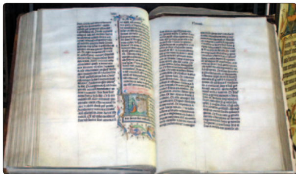
LXX, septuagint, er det latinske navn for den græske oversættelse af Det Gamle Testamente. Her vises en latinsk, håndskrevet bibel, der kan ses i Malmesbury Abbey, Wiltshire, England. Biblen er skrevet i Belgien i 1407 og er beregnet for højtlesning i et kloster.

Disse eksempler viser, at tal som 70 kan have forskellige konnotationer ud over deres matematiske betydning som antal. I nogle sammenhænge har man i kulturelt vigtige sammenhænge haft brug for at angive meget store antal – at sætte tal på uendeligheden.