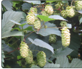
Humle er en af de planter, som har taget rejsen fra Øm Kloster via Jydsk Medicinhistorisk Museumshave til urtehaven ved Steno Museet.

Aarhus Universitet støttede samarbejdet ved at stille en attraktiv grund til rådighed på C.F. Møllers Allé i