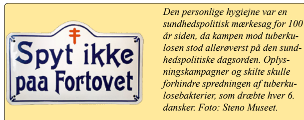
Den personlige hygiejne var en sundhedspolitisk mærkesag for 100 år siden, da kampen mod tuberkulosen stod allerøverst på den sundhedspolitiske dagsorden. Oplysningskampagner og skilte skulle forhindre spredningen af tuberkulosebakterier, som dræbte hver 6. dansker.