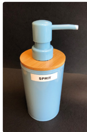
Håndsprit fra statsministerens kontor.

Sundhedspolitikken har bl.a. drejet sig om den personlige hygiejne, fordi vi skulle passe på os selv og hinanden ved at undgå at