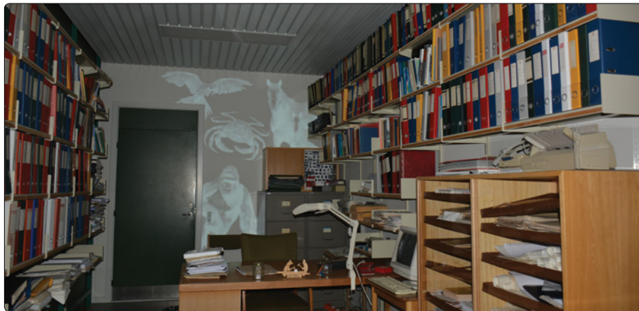
Jens Chr. Skous kontor er en inddragende oplevelse for mange besøgende.

God, fordi jeg under observationen så en del børn, der blev ved interiører, indgik i dialog med de voksne og viste en generel interesse for forskellige aspekter af udstillingen.