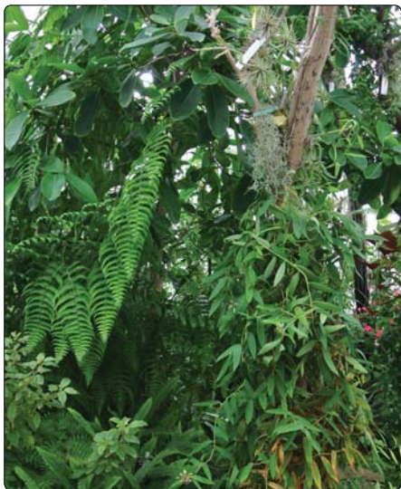
Der er stor frodighed i den sydamerikanske bjergskov. Her finder man foruden træer, buske og urter også mange bregner samt talrige epifytter.