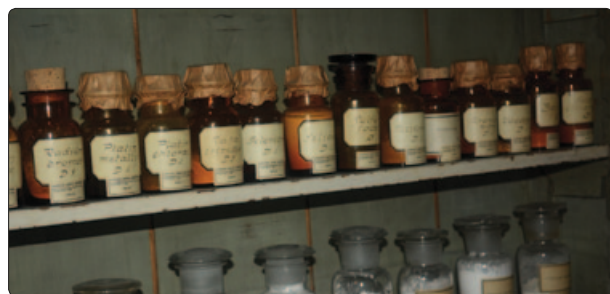
Det homøopatiske apotek i den medicinhistoriske afdeling.