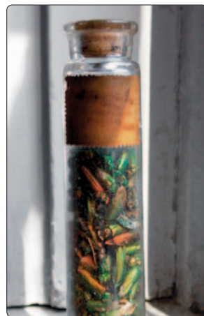
Spanske fluer brugt som medicin.