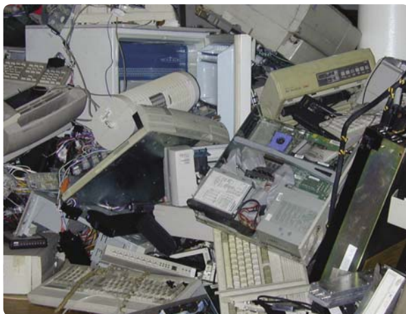
En samling af teknologisk affald fra den nye særudstilling.

Dette er nogle af de spørgsmål, udstillingen Din teknologiske hverdag tager op. Med udgangspunkt i billeder med en let aflæselig symbolik inspirerer udstillingen til at tænke over forholdet mellem det at være menne-