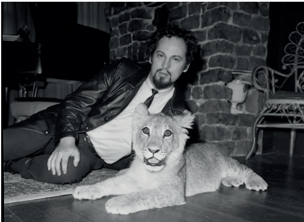
Anton Szandor LaVey, 1964.

Takket være surrealismen synes det, som om disse muligheder vender tilbage. Det er som om man genoplever i mørket en kostelig rædsel, Gud være lovet er det endnu kun skærsilden. Man gennemrejser skælvende det okkultisterne kalder farlige landskaber . Undervejs fremkalder jeg lurende uhyrer; de er endnu ikke særlig ildesindede over for mig, og jeg er ikke fortabt, fordi jeg frygter dem. Der er 'elefanter' som Soupault og jeg for ikke så længe siden skælvende af frygt for at møde. Her er den 'opløselige' fisk, som endnu skræmmer mig lidt. OPLØSELIG FISK – er det ikke mig, der er den opløselige fisk? Jeg er født i fiskens tegn, og mennesket er opløseligt i sin tanke! Faunaen og floraen i surrealismen er ikke noget man selv kan vedkende sig. 23