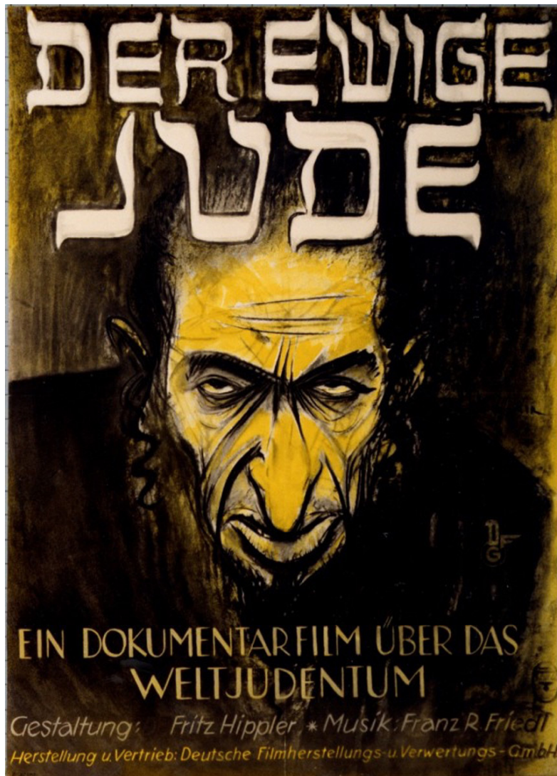
Filmplakat til Fritz Hipplers Der Ewige Jude , 1940.

imidlertid ikke, hvorfor alle jødernes kæledyr skulle henrettes. Forklaringen herpå skal igen søges i, at nazisterne ville fratage jøderne deres menneskelige karaktertræk, idet menneskeheden deler et universelt behov for følelsesmæssigt at knytte stærke bånd til dyr.