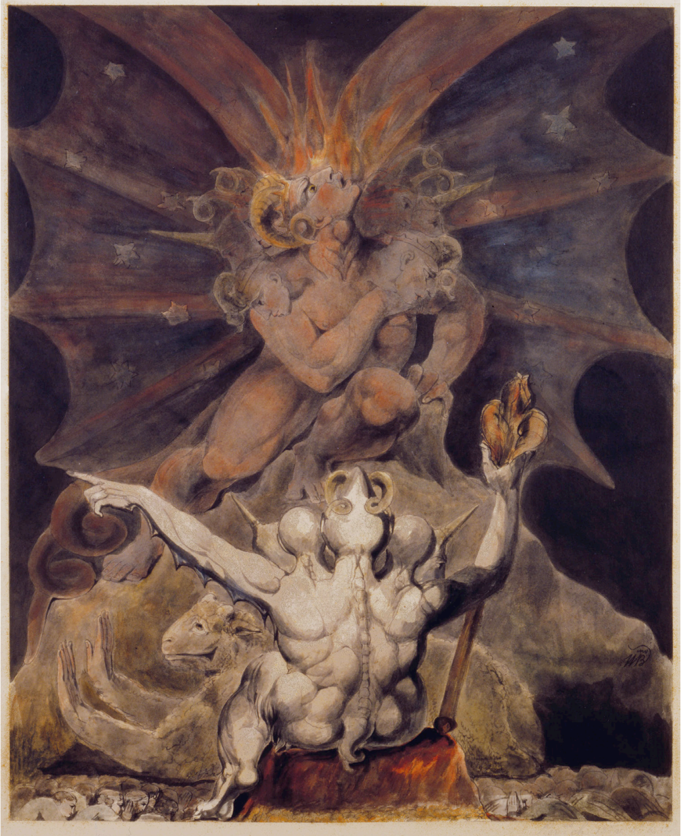
William Blake: The Number of the Beast is 666, 1805.