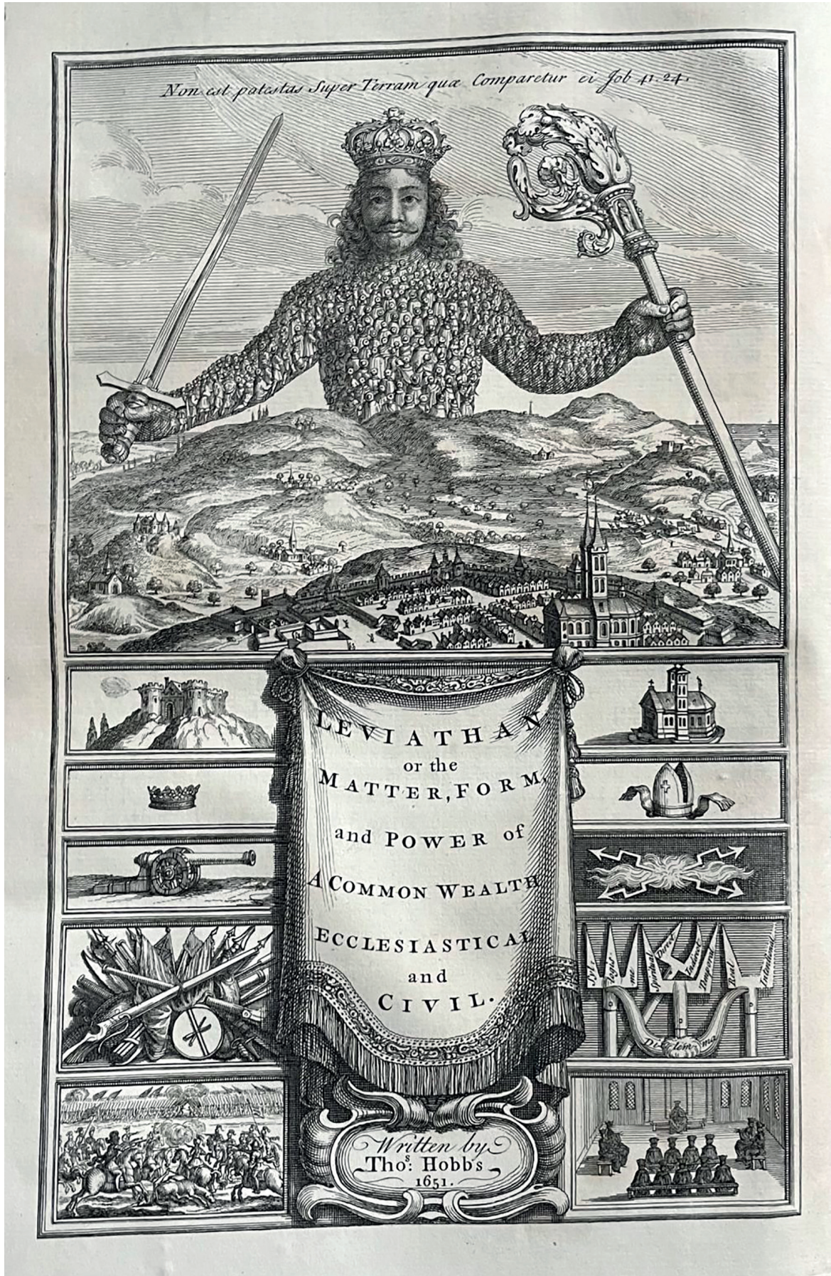
Frontispice fra Thomas Hobbes førsteudgave af Leviathan, 1651,