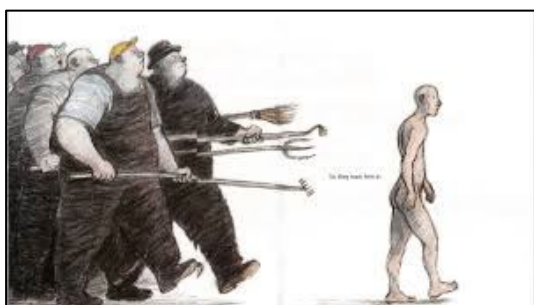
Greder, Armin (2007). The Island .

Som det fremgår af analysen ovenfor, indeholder The Island flere eksplicite eksempler på socialt ansvarlig adfærd. Alle disse eksempler er knyttet til fiskerens handlinger, der i bogen udelukkende udtrykkes gennem verbale ytringer. Fiskerens overbeviser øboerne om, at de skal tage den fremmede ind, da han først ankommer til øen, og udviser hermed empati: 'But the Fisherman knew the sea. 'If we send him back, it will be the death of him and I don't want that on my conscience,' he said. 'We have to take him in'. Endnu et eksempel på, at fiskeren handler socialt ansvarligt, finder sted i en scene, hvor den fremmede har bevæget sig ind i landsbyen