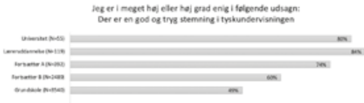
Figur 2. Motivationsorienteringer: relationsmotivation.

Ligeledes står mestrings-, videns- og præsentationsmotivationen rimeligt stærkt på alle uddannelsesniveauer (se figur 3).