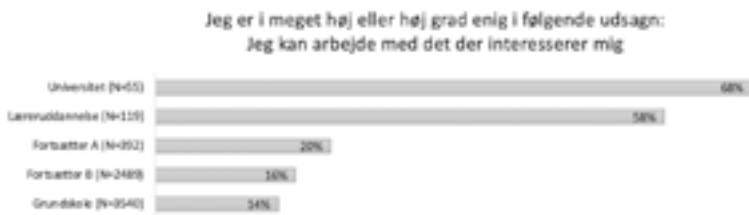
Figur 4. Motivationsorienteringer: involveringsmotivation.

ne: Halvdelen af grundskole- og fortsætter B-eleverne angiver, at de ikke oplever at have mulighed for at arbejde med det, der interesserer dem (se figur 4).