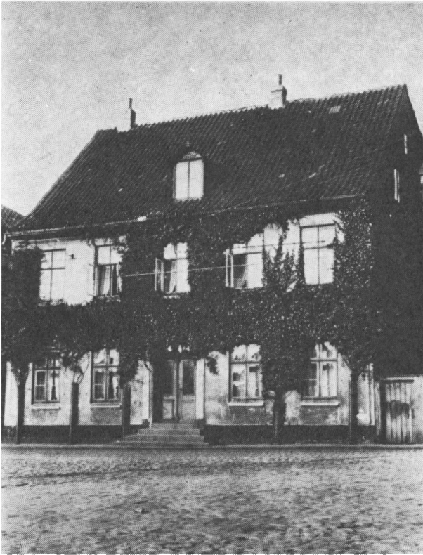
August Jørgensens embedsbolig i Altstadt (Rådhusstræde 16). Fotografi fra 1920'erne.

på grund af bevidst loyalt sindelag er genstand for en sådan forfølgelse, at de trænger til særlig understøttelse fra de loyales side.“ 27