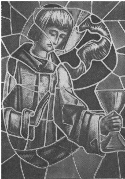
St. Johannes i glasmaleri.

som statutterne kræver det, er blevet tilbageleveret. Nylig er disse mindestykker kommet til Koldinghus .