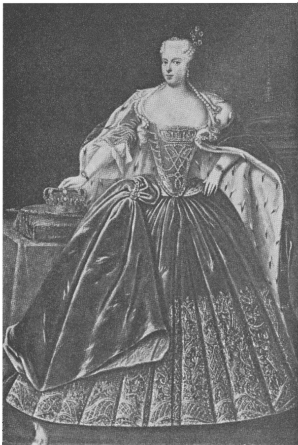
Dronning Anna Sophie (efter maleri på Brahe Trolleborg)