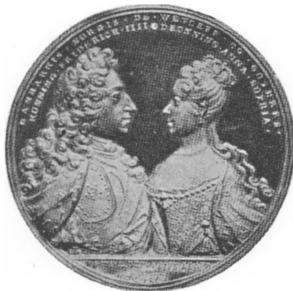
Medaille, der blev præget i anledning af dronning Anna Sophies bryllup og kroning i 1721.

hvad desværre alt for mange tegn tyder på, så frygter jeg, at den forudsigelse, som Buddeus er fremkommet med under en privat forelæsning, delvis vil opfyldes, nemlig at man så vil komme til at se vore folk falde fra som bladene af træerne i den sene høst.◀ 26