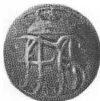
Livréknep af sølv, udført i 1722 af J. M. Lenair (Rosenborg).

Det er ikke ærefuldt at mindske en mands ære, men det er ret at lade ham selv komme til orde.