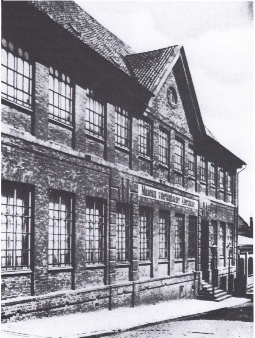
I 1768 fik Kiels universitet en ny bygning, tegnet af arkitekten Ernst Georg Sonnin. Siden blev den fra 1876 anvendt til Museum vaterländischer Altertümer. Den blev bomberamt og ødelagt under 2. verdenskrig og eksisterer således ikke mere.