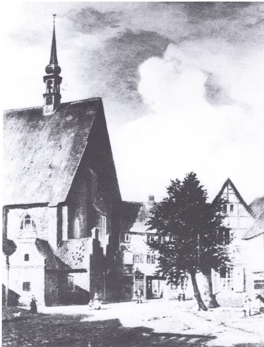
Helligåndskirken i Kiel med indgangen til klostergården og den ældste universitetsbygning, som var en del af det tidligere kloster. (Maleri af Adolf Lohse, midten af 19. årh.) Både kirken og klosterbygningerne blev ødelagt ved luftbombardement under 2. verdenskrig.