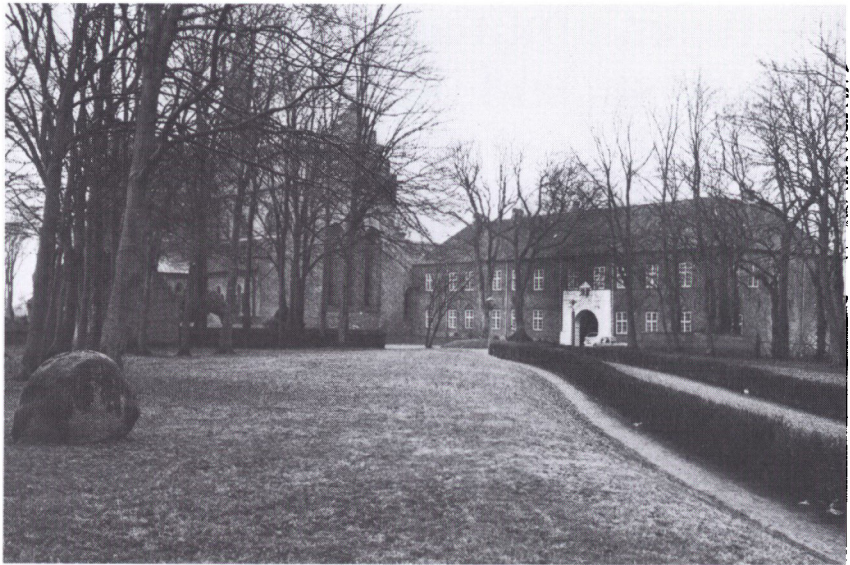
Slottet i Løgumkloster opstod ved en udbygning af klostret, hvorved den gamle kirke fik en ny funktion som slotskirke. Den nyopførte hovedfløj virker lidt uanseelig ved siden af kirken, men faktisk er de to bygninger af samme længde. Fløjens oprindelige karakter er svækket af et afvalmet tag fra nyere tid; tidligere havde bygningen sadeltag med stengavl i øst og vest samt en mindre, muret gavl i nord, velsagtens over portalen. Set fra nordvest. NTS fot. 1986.