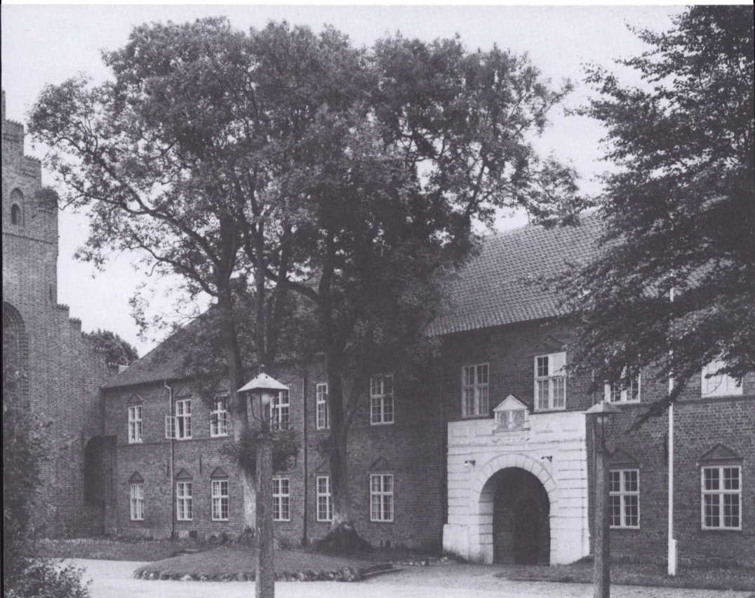
Den monumentale indramning af porten i hovedfløjens nordfacade synes anbragt en tid efter bygningens færdiggørelse. Bygningstavlerne over porten er helt sikkert uden oprindelig sammenhæng med portindfatningen. Tavlerne på bygningen er kopier, originalerne findes på Tønder Museum. Lennart Larsen fot. 1963.

tallet. Her får det betydning at samle de tilgængelige oplysninger om Løgumkloster amt 6 og derefter søge at vurdere, hvornår der forelå en optimal situation, hvori slottet mest sandsynligt kunne være bygget.