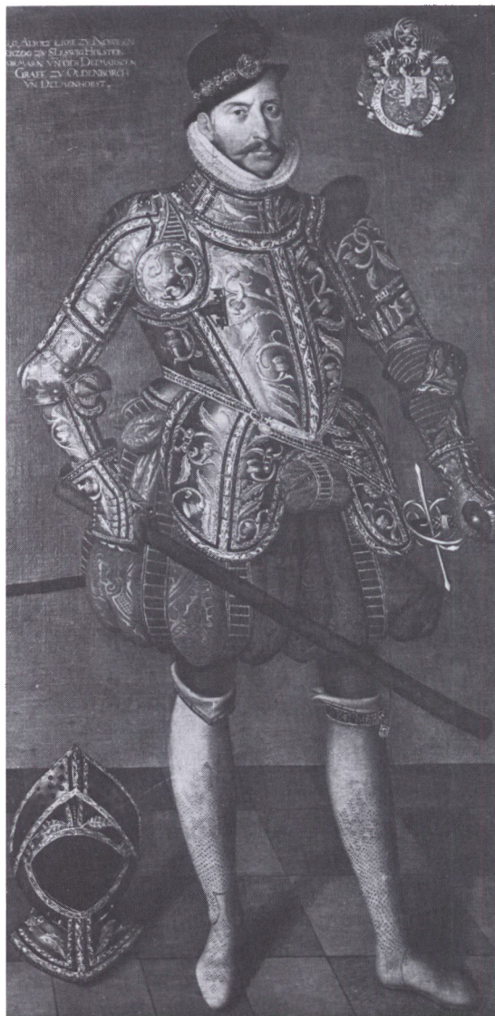
Hertug Adolf af Gottorp, Løgumkloster slots formentlige bygherre. Maleri fra ca. 1580 på Eutin slot. Historiske Samlinger, Aabenraa.

Adolf ønskede. Hertug Hans' bygning blev derfor nedrevet, og hen over tomten blev bygget »det lange nye hus«, der højst sandsynligt er identisk med slottets endnu eksisterende hovedfløj. Denne bygning har stået færdig kort før 1587. Muligvis har hertug Adolf ikke selv oplevet bygningens færdiggørelse, idet han døde allerede 1586. Og det kan vel tænkes, at slotsanlægget i sin