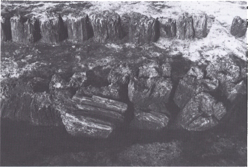
Udgravede palisader i Olmersdiget – måske Angler-rigets værn mod nord – ved Almstrup øst for Tinglev. I vor ofte miljøbevidste tid kan vi ved synet af digets solide pælerækker nok anstille betragtninger over, om man i oldtiden just har været skånsom over for den gamle egeskov. Foto Hans Neumann 1972. Haderslev Museum.

friserne på den tid endnu ikke var indvandret til denne landsdels vestkyst). Som sydlig afgrænsning må det være mest naturligt at pege på ødemarksområdet på begge sider af Ejderen.