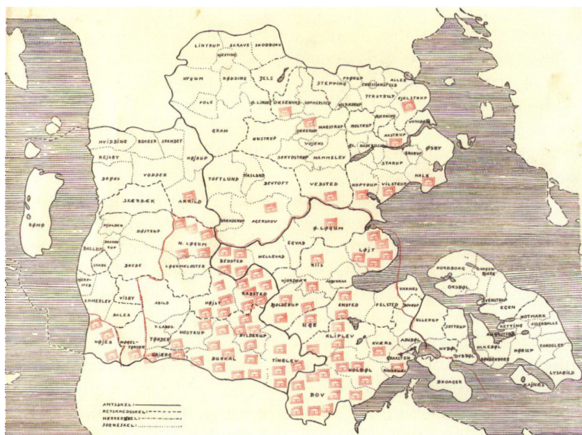
Kort – formentlig fra 1945 – der viser placeringen af de gårde, hvori Kreditanstalt Vogelgesang havde udstedt pantebrev.

Kreditanstalt Vogelgesang måtte overtage, hvis låntagerne ikke kunne betale deres skyld til kreditforeningen. I 1932 blev aktiekapitalen udvidet til 250.000 kr. Aktierne var ihændehavepapirer, hvoraf 25.000 kr. ejedes af Kreditanstalt Vogelgesang og 225.000 kr. af 4 forskellige tyske stråmænd for Acobe. Kreditanstalten arbejdede foruden med aktiekapitalen med et banklån, som den i de første år tog i det ovennævnte slesvig-holstenske bankkonsortium og fra 1930 i Acobe. Dette banklån var altså ligeledes finansieret af den tyske stat. I perioden 1930-1944 lå lånet på omkring 3-4 millioner kr., mens det de første år lå noget højere, men reduceredes ved at HVG i 1929 overtog 1,9 millioner kr. af lånet.