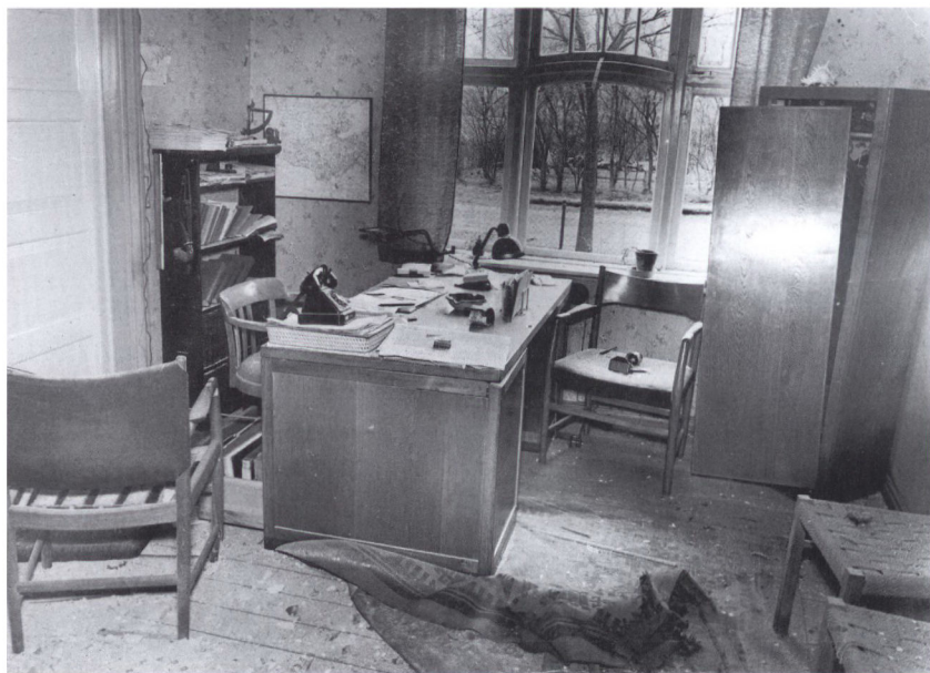
Politikontoret i Tinglev, raseret af NJW's håndgranat. LAÅ, Tønder Politi nr. 1731, straffeakt 3335.