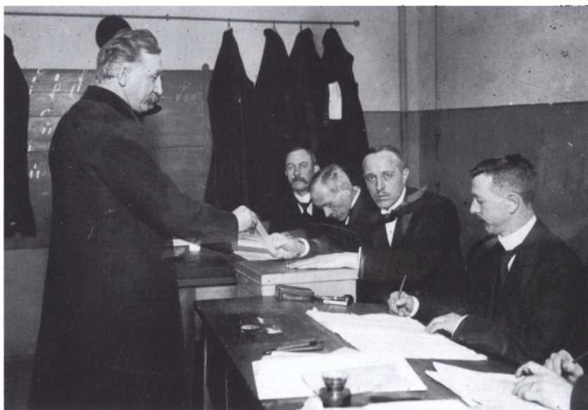
Det danske mindretals leder, redaktør H.P. Hanssen, afgiver sin stemme ved et valg, mens Sønderjylland endnu var under tysk styre. H.P. Hanssen (1862-1936) var redaktør af Aabenraa-avisen Hejmdal. I årene 1906-19 repræsenterede han mindretallet i den tyske rigsdag, og 1919-20 varetog han som minister for sønderjyske anliggender i den radikale Zahle-regering landsdelens interesser i afstemningsperioden. Fra Vejen hjem, s. 52.

fredsslutning mellem de stridende stormagter og den sønderjyske leder, redaktør H.P. Hanssens indtræden i Zahle-regeringen som særlig ansvarlig for sønderjyske anliggender. Kongen benyttede denne anledning til at gøre sin holdning helt klar over for den samlede regering. I en udtalelse ved mødets begyndelse fastslog han: 8