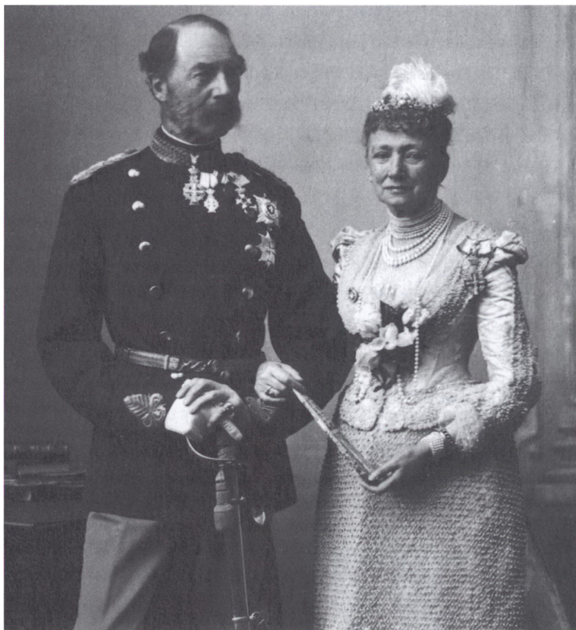
Officielt foto af Christian IX og Dronning Louise i anledning af deres guldbryllup i 1892. Christian IX forblev hele livet tro mod de konservative normer, som han var vokset op med under den sene enevælde. Han blev også i denne henseende et forbillede for sønnesønnen Christian X. Fra Rytterkongen, s. 43.

de parlamentarismen i Danmark. Med sin militære baggrund og soldatermæssige tankegang lå han i adfærd og tankesæt langt nærmere på sin bedstefar, Christian IX, som han gennem hele sin barndom og ungdom havde knyttet sig nært til og nærede stor beundring for.