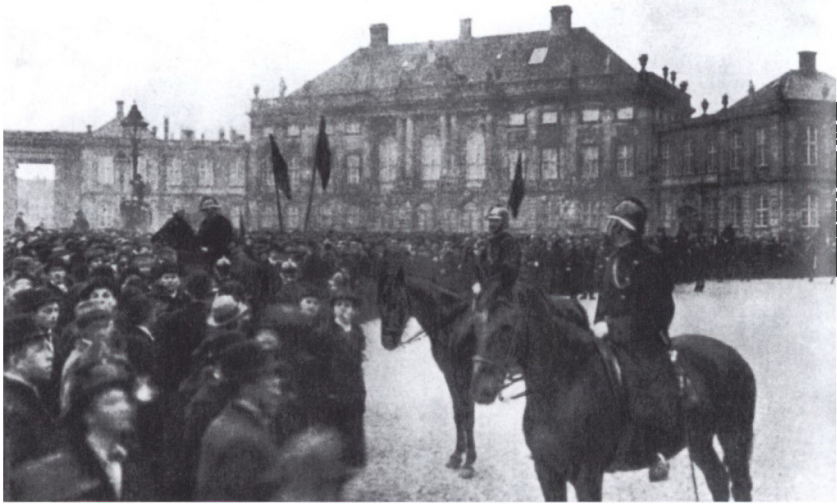
Folkelig demonstration på Amalienborg Slotsplads i de kritiske dage under Påskekrisen omkring 1. april 1920. Om ikke før erfarede Christian X ved denne lejlighed hvilken høj pris, der kunne være forbundet med at være politiserende monark. Fra Rytterkongen, s. 312.

stian X, der – som det vil være fremgået af gennemgangen af hans ytringer helt tilbage til 1918 – af hele sit hjerte ønskede hele Slesvig tilbage, om fornødent som led i en slags helstatsløsning, for på den måde at indfri den gæld, som han mente at stå i til sine forgængere på tronen. For ham var sagen personlig og slægtsbestemt, og under hans synsvinkel repræsenterede et betydeligt tysktalende befolkningselement ikke noget større problem, ligesom forholdet til det slagte Tyskland ikke for ham spillede nogen særlig rolle. På den anden stod den radikale regering. For den var hensynet til Tyskland en hovedsag og en videreførelse af krigsårenes neutralitetskurs med tysk hældning fortsat vigtig for Danmarks sikkerhed. Derfor modsatte den sig med næb og kløer en grænsedragning, der implicerede et stort tysk befolkningselement nord for den dansk-tyske grænse. Det kunne efter deres opfattelse blive yderst farligt, når Tyskland engang atter rejste sig af asken.