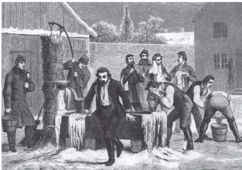
»Ved Soldatens Morgentoilette«. Tegning af Carl Bögh i Illustreret Tidende 31. januar 1864. Fra To Hundrede Træsnit , s. 16.

større baraklejre var der indrettet latriner. Men på Dybbøl måtte nødtørften forrettes i det fri direkte på jordoverfladen, hvor det blev liggende, da soldaten ikke var udrustet med en feltspade. At det kunne få uheldige følger, hvis en forpostvagt mærkede imperativ afføringstrang, berettes der om i en tragikomisk in flagranti episode: »En vedet var henne på naturens vegne i det uheldige øjeblik. Manden havde fået smidt lædertøj og gevær og var ikke blevet rigtig færdig med at knappe op, da preusserne tog ham i kraven.« 72 Det anale toilette foregik med græs, halm, blade eller manuelt – eller slet ikke. På denne måde kunne spredningen af salmonellalidelsen »tyfus« brede sig ved berøring med fæcesblandet jord eller vand eller ved direkte kontakt mand og mand imellem. I øvrigt kan det, som tidligere anført, ikke udelukkes og er vel højst sandsynligt, at inficerede fødevarer var indgangsporten til denne lidelse.