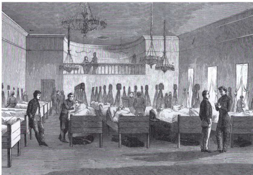
»Lazareth i »Borgerforeningens« locale i Flensborg«. Fra To Hundrede Træsnit, s. 29.

krigssofrene. Linje 2 lazaretterne lå lidt længere bagude, i sikkerhed mod fjendens angreb og beskydning, og lazaretterne i linje 3 blev placeret langt fra krigsområdet i de militære sygehuse og kaserner i København og Helsingør. Linje 1 og 2 lazaretterne måtte være forberedt på hurtigt opbrud og flytning i takt med krigens udvikling. Ved udgangen af april var lazaretterne på landsbasis indrettet til at huse 9.000 patienter, men kun 7.000 var indlagt, deraf 1.569 sårede. 60