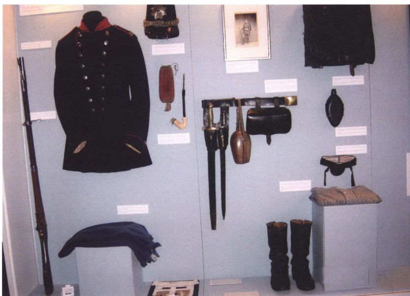
Infanteristens mundering, dog mangler brødpose og kappe. Montre i Museum Sønderjylland Sønderborg Slot.

det vil fremgå i det følgende, en jævn strøm af kritik og klager, især under krigens første fase.