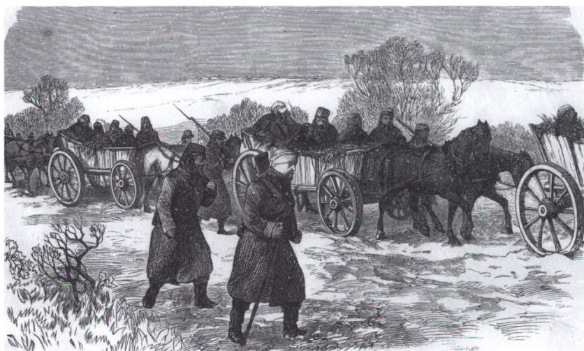
»Transport af sårede« fra slaget ved Sankelmark. Fra To Hundrede Træsnit , s. 28.

til vognkørsel eller til pasning af heste. 21 De blev aflønnet med 32 skilling daglig, når de var i funktion og modtog godtgørelse for slitage af egne klæder. 22 Den 1. februar taltes 1.537 ægtkuske, faldende til 814 den 1. marts og 220 den 1. juli. 23 Disse tal viser, at kørselsbehovet var aftagende, efterhånden som krigen skred frem, og især efter at hæren havde forladt den udstrakte frontlinje ved Danevirke med de lange forsyningslinjer.