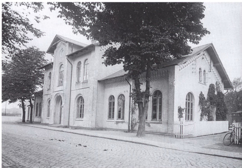
Aabenraa statsbanegård i 1920'erne. Havde det stået til H.P. Hanssen, var der blevet bygget en ny og større banegård. Det blev ikke til noget, og bygningen kan stadig nydes i Aabenraas bybillede.

da han gik ind for forslaget om at afskaffe disse to byers og Københavns ret til herreløs arv. Han fandt, at det reelle udbytte af disse privilegier var meget ringe, og at ensartede bestemmelser for hele landet var vigtigere. 58 Den samme indstilling prægede hans syn 1925/26 på den kommende tinglysningslov: de almindelige danske regler burde indføres i Sønderjylland. H.P. Hanssen fik her sæde i det udvalg, som blev nedsat. 59