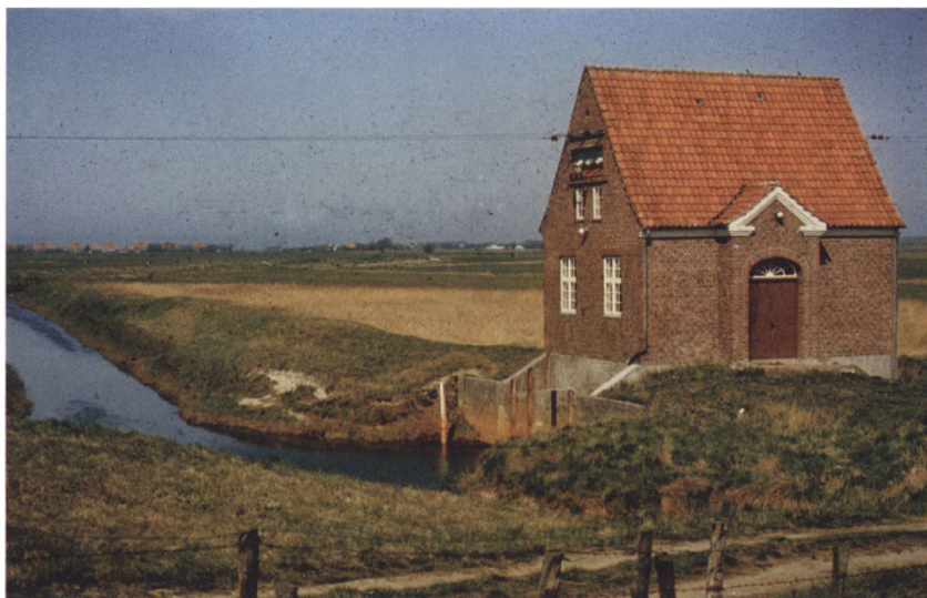
Reguleret og inddiget åløb med pumpestation i Tøndermarsken efter afvandingen i 1920'erne. Bemærk strømforbindelsen til Sønderjyllands Højspændingsværk i Aabenraa. H.P. Hanssen foreslog, at strømmen blev købt her i stedet for at oprette et vandkraftværk.

medvirkende landmænd blev sat så lavt som muligt. Det var nemlig ifølge loven finansministeren, som skulle fastsætte renten. Oprindeligt var den tænkt at skulle være 4% årligt og afdragene 1/2%, men blev alligevel i loven sat til 6% og afdragene til 1%. Det havde skabt en betydelig opposition mod projektet i digelaget, som blev forstærket af den nye tyske toldtarif, der lagde hård told på importen af levende kreaturer og dermed reelt afskar marskbønderne fra deres traditionelle marked syd for grænsen. I nationalistiske kredse i Kiel havde man søgt at udnytte dette i kampen for en grænseflytning. 47