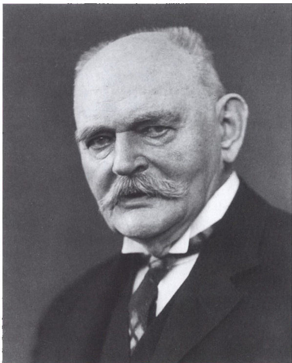
Niels Thomasius Neergaard (1854-1936) var Venstres statsminister 1908-09 og 1920-24 samt finansminister 1908, 1910-13 og 1926-29. Han huskes i dag måske snarere som forfatter til det solide trebindsværk Under Junigrundloven om Danmarks politiske historie 1848-66.

gaards udtalelse i Folketinget en lille måned senere, den 18. oktober 1923: »Jeg har sagt det før, og jeg gentager det her: Grænsen ligger fast, og der vil fra regeringens side blive gjort alt for at opretholde den. Danmark spekulerer ikke hverken i Tysklands ulykke eller i noget andet nabolands ulykker.« 16 Konkret betød det, at Neergaard afviste at støtte private bestræbelser på at udnytte den tyske inflationskrise til at hverve blandt sydslesvigerne for landsdelens tilbagevenden til Danmark. H.P. Hanssens opstilling og Neergaards tale var dermed en kold spand vand i hovedet på Flensborgfolkene.