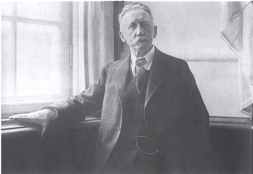
H.P. Hanssen fotograferet i den danske rigsdag.