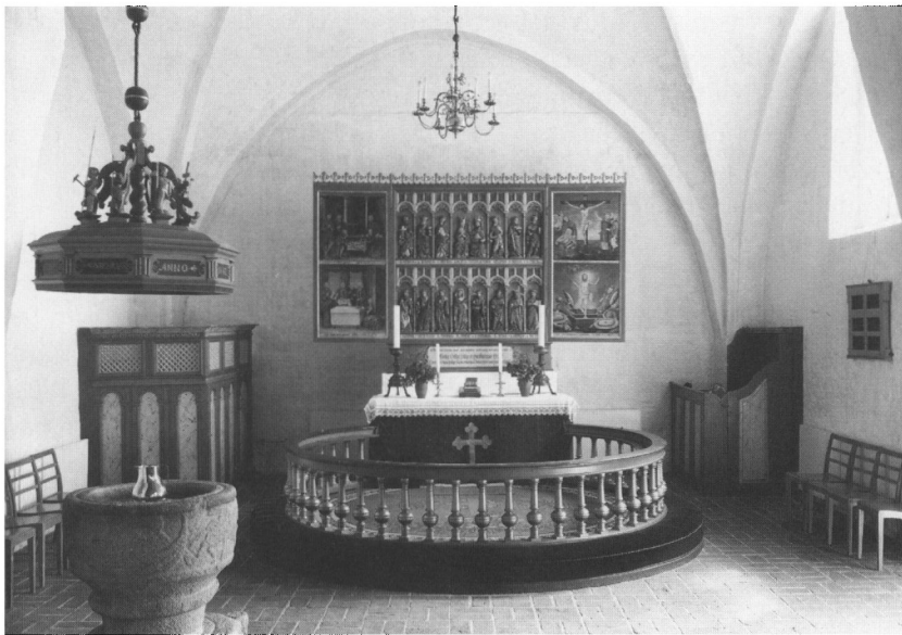
Felsted kirke. Korets indre med døbefonten, set mod øst.

På fontefodens sider er udhugget dyrerelieffer, hvoraf to er (delvist) identificerbare. Mod vest ses en hund og mod syd (sandsynligvis) en hjort. Hvilke dyr, der kan have været på de to andre sider, kan i dag ikke ses. I fodens hjørner er udhugget fire barske mandshoveder, hvoraf to er ganske velbevarede, men de to andre er stærkt forvitrede. På issen af disse hoveder ses tydeligt en planhugget cirkel med en ca. 3 cm bred ring. Den runde flade kunne opfattes som base for en søjle, men det kan næppe være meningen, da det ikke er muligt at placere søjler her.