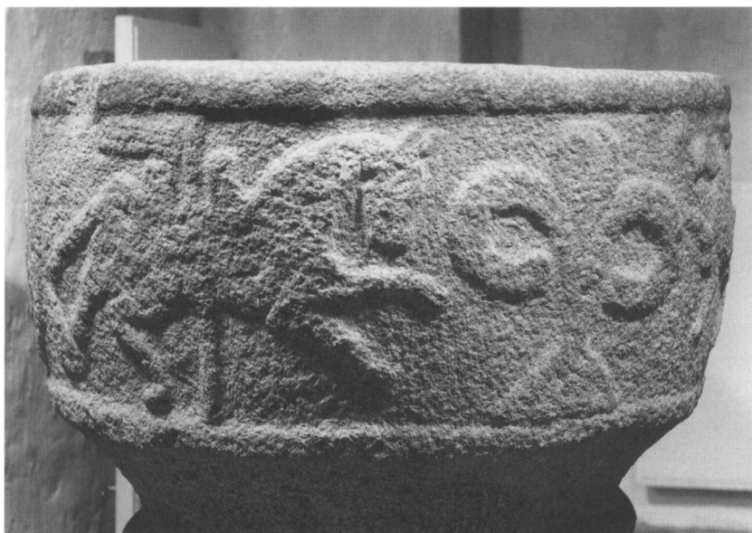
Felsted kirke, del af døbefontens kumme, ridder og lilje.

han sås i den gamle danske bondeleding, hvor spydet og den danske økse (vikingeøksen) var hovedvåbnene. Øksen ses på gravsten fra vikingetid og tidlig middelalder og på enkelte kalkmalerier, da som regel som symbol på den norske helgenkonge Olav den Hellige, ligesom de kendes fra fund fra krigergrave og gamle slagmarker, ikke mindst fra Grathe Hede, hvor den jyske fodfolksleding vandt et af sine sidste store slag i 1157, da Valdemar (den Store, Knud Lavards søn) besejrede Svend Grathe (søn af Erik Emune). Manden synes at bære hjælm. Han holder et spyd i den ene hånd, mens den anden hænger frit. Foran ansigtet anes et eller andet, måske et horn. Det virker blot mærkeligt, at »hornet« svæver frit i luften, mens den hånd, der skulle have holdt det, er ledig. Der er måske slet ikke noget horn, men blot en buling i stenen.