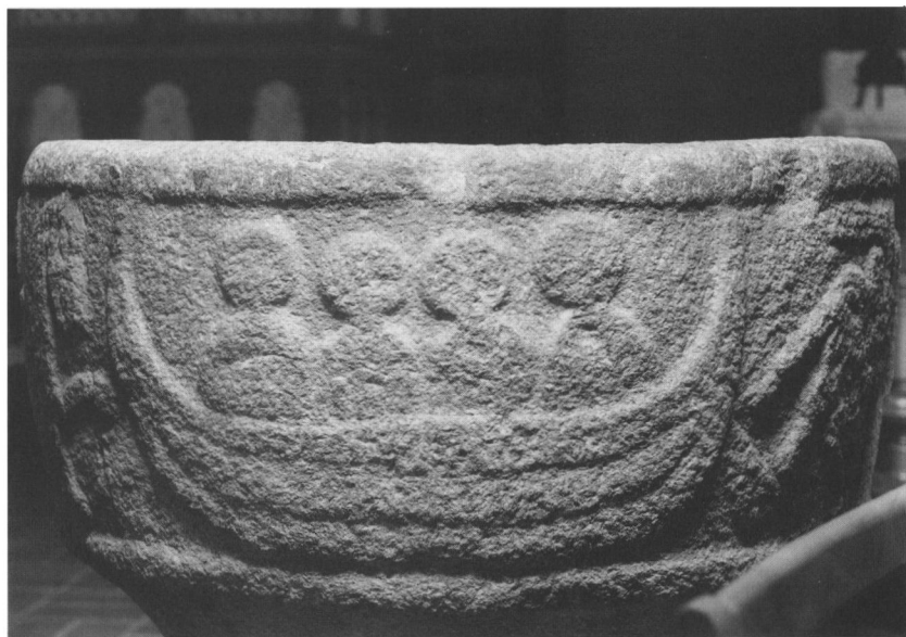
Felsted kirke, del af døbefontens kumme, båd med fire personer.

ske bondekultur fra vikingetiden – kæmpede om overtaget i Danmark. Kort sagt: første halvdel af 1100-tallet.