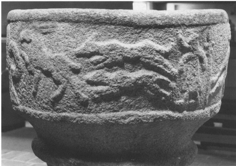
Felsted kirke, del af døbefontens kumme. Til højre jæger med spyd og jagthorn, som med sine to hunde (i midten) jager en hind (yderst til venstre).

thi Peder af Roskilde og den svenske biskop Henrik og alle de jyske bisper på én nær skal være omkomne i det slag«. Bortset fra det tidligere citerede om bisp Peder, der faldt sammen med Magnus, siger Saxo ikke noget om, på hvis side bisperne kæmpede! Og med udtrykket »skal være omkommet« dækker han, at to jyske bisper ikke blev dræbt, og – for i hvert fald den enes vedkommende – næppe deltog i slaget. Det er dog sandsynligt, at den ellers særdeles velunderrettede Saxo, der havde adgang til alle samtidige kilder, har vidst besked, men at virkeligheden ikke svarede til det billede, han ønskede at give.