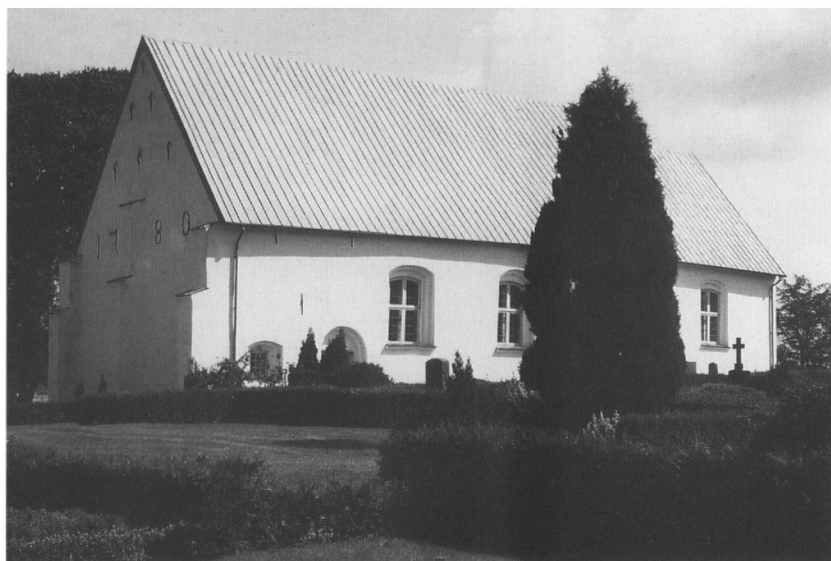
Felsted kirke set fra sydvest.

teologiske skrifter tillægges ham. Det er dog næppe sandsynligt, at man i Felsted har haft relikvier af denne betydelige franske teolog og kirkelærer – eller for så vidt af en af de to andre. Men det forhindrer naturligvis ikke, at man kan have troet det.