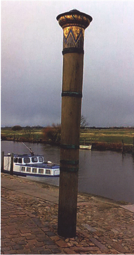
Stormflodssøjlen på Skibbroen i Ribe, som vi kan se den i dag. Det øverste jernbånd på søjlen markerer vandstandens højde ved stormfloden i oktober 1634.