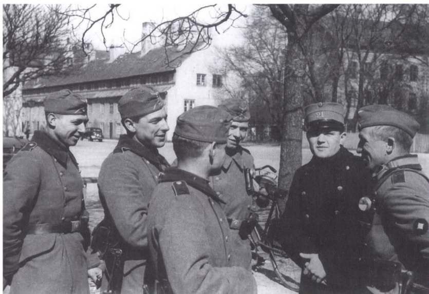
Kastellet i København blev indtaget af de tyske tropper om morgenen den 9. april 1940. Frem til befrielsen i maj 1945 blev anlægget blandt andet brugt som krigsret og arrest. På billedet, der er taget den 9. april om morgenen, ses tyske soldater i fredelig samtale med en dansk soldat – formentlig et medlem af den vagtstyrke, der stationeret dér den 9. april.

stellet i København. Efter at have afleveret deres personlige genstande blev de indsat i hver sin celle. 23