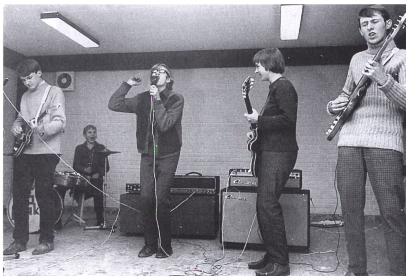
The Sparks i øvelokalet ca. 1967-1968.