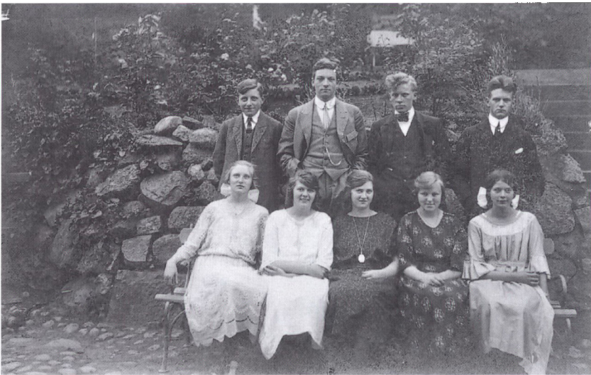
Det første hold realister fra Nordborg Skole 1923. Ni ud af ti er med på billedet. De følgende år var antallet af dimittender lavere, hvilket betød, at udgifterne pr. realist steg betydeligt.

Først fra 1931/32 begyndte antallet af skolebørn at stige lidt igen.