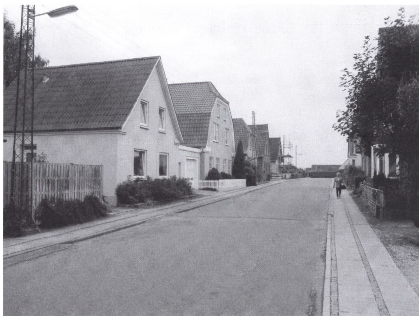
Højgade 1 i Rødekro, hvor forhandlingsprotokollen for DNSAP i Sønderjylland 1943–44 blev fundet under taget i 1984.

med en omhu, så der kommer en hel historie ud af det. På et kritisk tidspunkt i partiets historie får vi mulighed for at kigge med i partiarbejdet i syslet. Protokollen tjener både til at belyse vidensniveauet om partiforhold i syslet, kommunikationen mellem syslet og partiledelsen, ligesom den giver et godt billede af opfattelsen af og relationerne til »gesandtskabet«, som besættelsesmagten her bliver betegnet. Flere referater af møder i DNSAP's ledelse kendes udelukkende fra denne protokol, da der kun foreligger få referater fra møderne i DNSAP's lederråd og førerråd. Endvidere kan protokollen med fordel bruges som udgangspunkt til at studere, efter hvilken praksis ledere i partihierarkiet blev udnævnt. Det, der af nogle er blevet kaldt Frits Clausens »personalepolitik«, og af andre er blevet betegnet som hans sygelige angst for at udnævne kvalificerede personer til ledere, der kunne gøre ham rangen stridig. Endelig giver protokollen et enestående indblik fra sidelinjen i den standende konflikt mellem den tyske rigsbefuldmægtigede Werner Best og Frits Clausen om forholdet til Schalburgkorpset. Dette korps var oprettet foråret 1943, og dets hensigt var