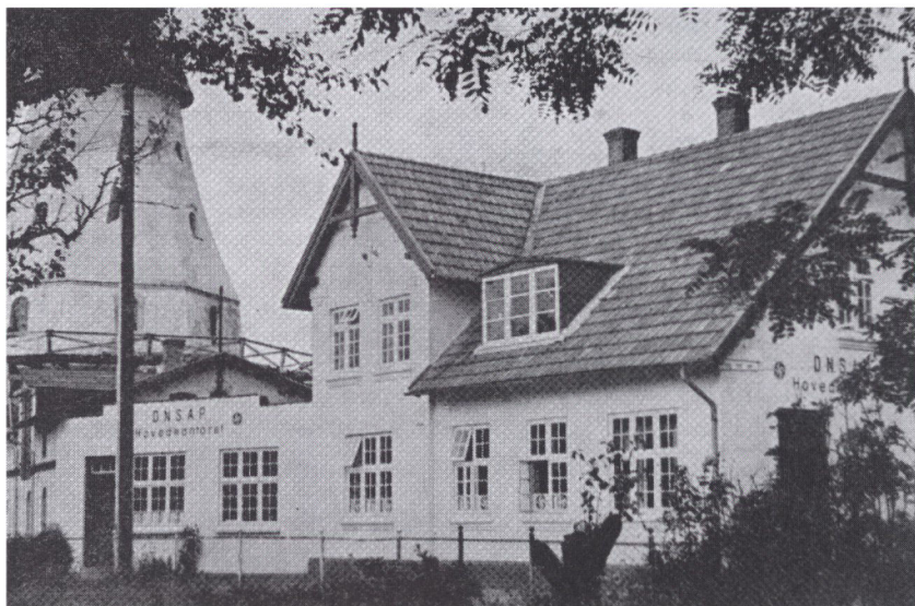
Hovedkontoret i Bovrup. Gengivet efter Jul i Norden 1942.