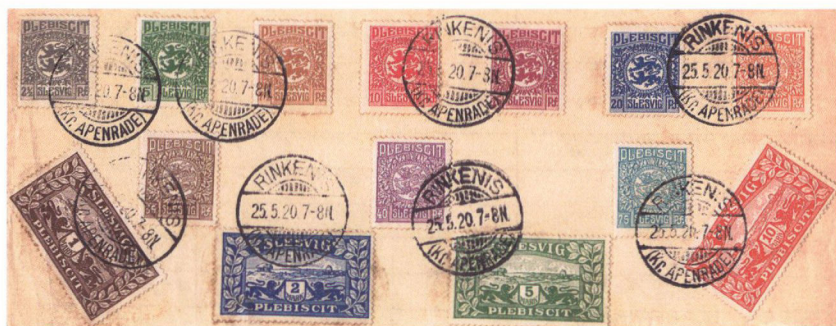
Ark med samtlige plebiscit-frimærker. Det er ingen underdrivelse at sige, at de er en fryd for øjet, ikke mindst mark-værdierne.

Det er en interessant detalje ved frimærkerne, at Slesvig staves efter dansk retskrivning og ikke efter den tyske. I alle udgaver indgår de slesvigske løver som motiv og betegnelsen »Plebiscit« står på en fremtrædende plads øverst i pfennig- og nedadtil i mark-frimærkerne.