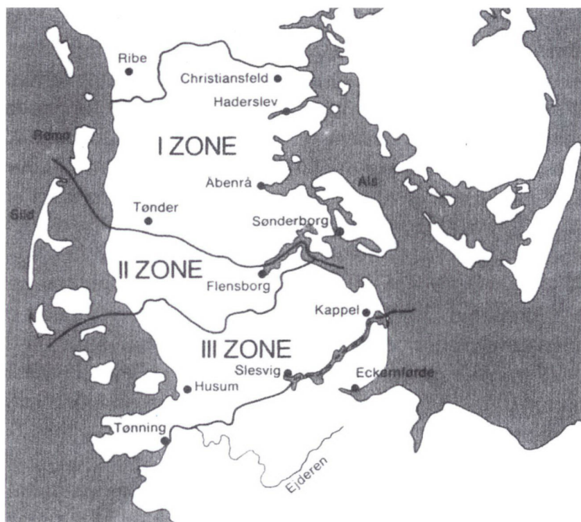
Zoneinddelingen i Slesvig. En Zone III blev aldrig aktuel. Gengivet med tilladelse af afdøde tegner Arne Gaarn Baks søn.

Ifølge Versailles-traktatens ordlyd skulle Slesvig rømmes for tysk militær, hvorefter området udøvende og lovgivende myndighed i de geografisk nøje angivne zoner I og II i afstemningstiden skulle overdrages til en international kommission, der fik betegnelsen »Commission Internationale de Surveillance du Plébiscite Slesvig«, forkortet til C.I.S. Kommissionen skulle efter traktatens ordlyd bestå af fem kommissærer, der blev udvalgt i perioden juni til juli 1919. Tre medlemmer blev udpeget af de allierede hovedmagter og to af henholdsvis den norske og den svenske regering.