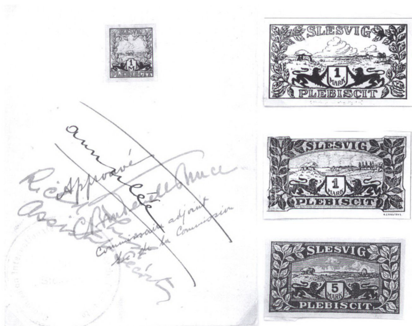
I sort-hvid tryk ses t.v. den primært godkendte, men derpå annullerede udgave af frimærkerne i mark-værdier. T.h. de forkastede andet og tredje udkast og nederst den godkendte udformning med kirken i baggrunden til højre.