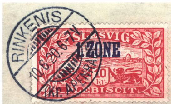
Frimærke med 1. Zone-stempel. Postkontorets frimærkestempel er endnu ikke (den 10. juni 1920) blevet ændret til dansk stavemåde.

generalsekretæren med 5.000 kroner og postdirektør Ræder med 1.000 kroner, og alle havde desuden frit ophold. 33