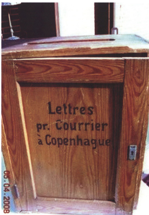
Kommissionens interne postkasse (52×38×16 cm), som indtil for nylig har været i familien Ræders besiddelse.

iblandt tyske. På mappens omslag er modtagerens navn og de slesvigske løver indfældet i guld. 35