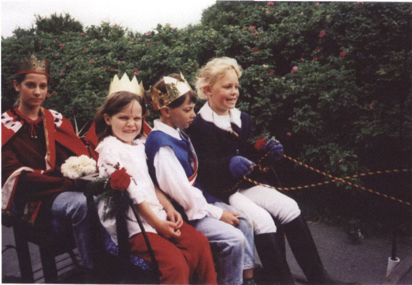
»Så var der fugleskydningen, børnenes fugleskydning« sammen med de danske skoler i Garding, St. Peter og Tating. Her fra børnenes fugleskydning i 1998.