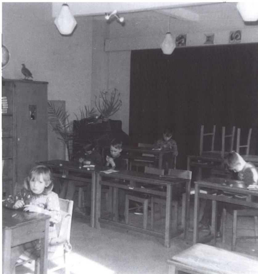
Skoleklassen formentlig fotograferet engang i 1950'erne, hvor musene endnu kunne afbryde undervisningen.