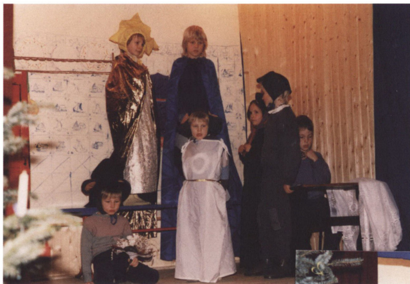
»Giftes med den mægtigste i hele verden«. Alle fik en rolle, når der blev spillet teater på skolen.

kirker i Ejdersted. Ejdersted har mange dejlige kirker, 18 kirker i alt, som vi besøgte, så de fik en fornemmelse af egnen. Noget at sætte historien fast på. I kirken kunne jeg fortælle landsbyens historie, og de sagn, der var knyttet til landsbyen. Efterhånden som vi blev flere, kunne man ikke længere putte dem i skolebussen og tage af sted. Nogle af lærerne tog på lejrskole med børnene. Det har jeg aldrig gjort. Vi har haft to større ture til Vestfrisland i Nederlandene for at give børnene en fornemmelse af, at der var frisere hele kystregionen rundt, og derigennem give dem en historisk baggrund. Vi havde også i hjemstavnskundskab – ja, det fandtes vel ikke mere til sidst – lidt frisisk undervisning bare for, at de lærte det sprog, der engang blev talt her, inden plattysk og dansk kom. De havde engelsk og kunne sammenligne sprogene, se ligheder, og hvad der var fælles for disse sprog. Det var helt sjovt. Så var der fugleskydning, børnenes fugleskydning. Det var sammen med Garding danske skole. Mens der var danske skoler i St. Peter og i Tating, var alle fire danske skoler med til den store fælles fest.