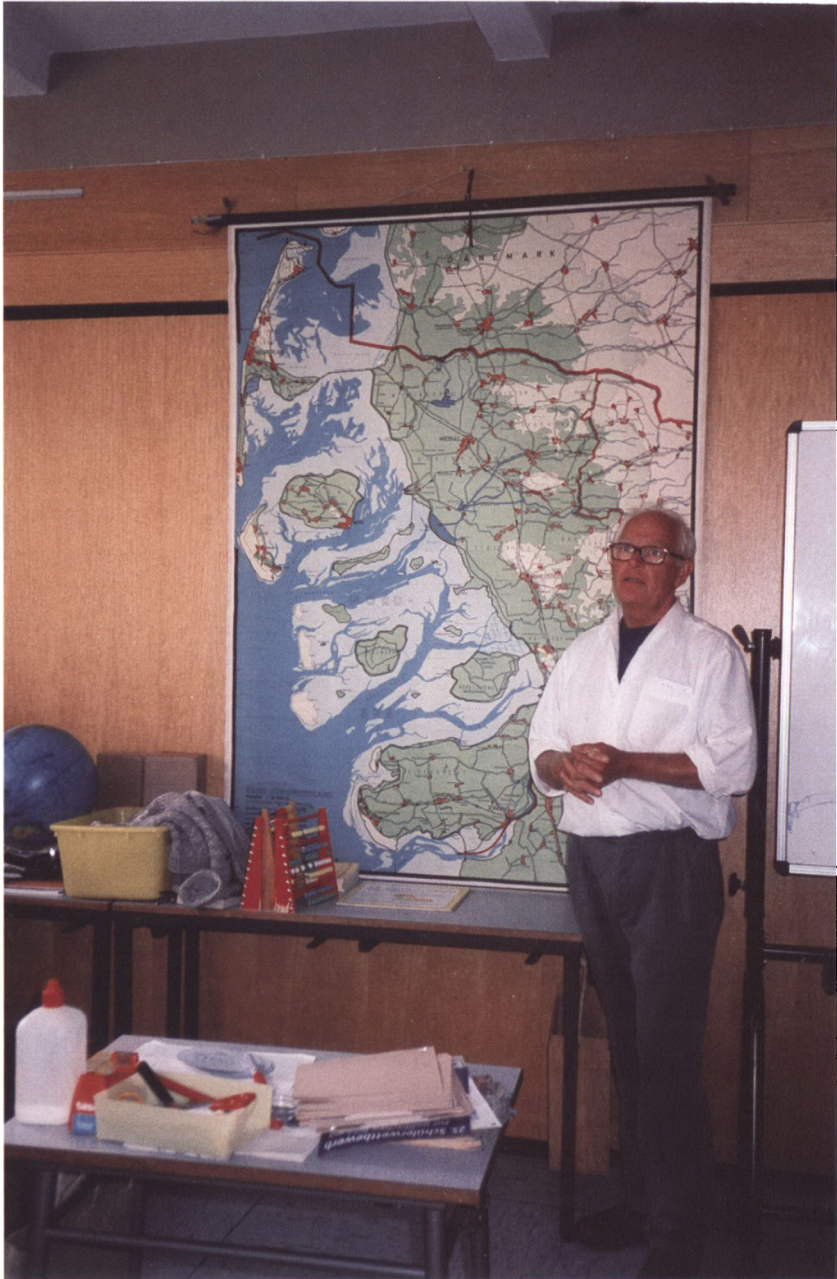
Udgangspunktet for undervisningen var hjemstavnen.