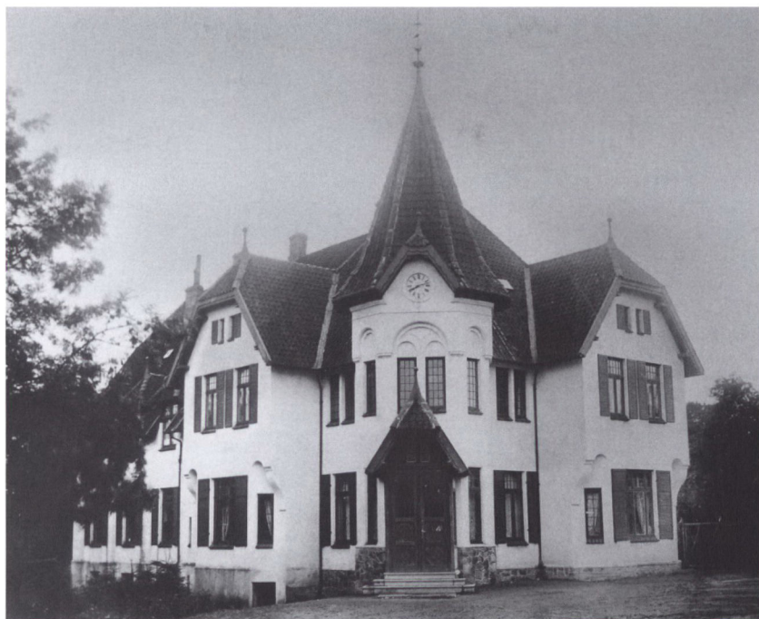
Grøngrøft, en af Gråsten-egnens store gårde, der blev konfiskeret og senere omdannet til institution.

alet i Søgaard var på 20 ha og indtil 31. december 1946 bortforpagtet til en kreaturhandler i Aabenraa. Rederens datter havde tinglyst forkøbsret til Benniksgård.