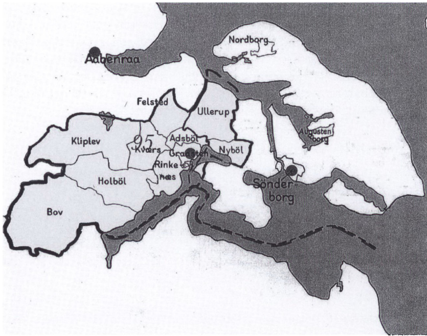
Kort over Gråsten retskreds. Artiklen bygger på en gennemgang af 221 enkeltsager fra denne retskreds. (Atlas over Danmarks administrative inddeling efter 1660).

Som repræsentant for kommissarius påhvilede det Lind at drage omsorg for, at den konfiskerede ejendom ikke forringedes i værdi eller henlå uden opsyn. En ansøgning om dispensation bevirkede, at konfiskationen blev sat i bero, men var konfiskationen en kendsgerning, blev det konfiskerede afhændet. Konfiskeret ejendom blev sendt i offentligt udbud, og Lind fulgte den procedure at sende de indkomne bud i en lukket kuvert til kommissarius til dennes afgørelse. Lind undgik her at blive inddraget i forhandlinger med lokale liebhavere til de undertiden meget attraktivt beliggende ejendomme ved Flensborg Fjord. Møbler, andet indbo og f.eks. værktøj blev bortauktioneret på offentlig auktion til højeste bud. Det fremgår af Gråsten-sagerne, at Lind undertiden har haft en særdeles omfattende administration af diverse konfiskations-sager. Dette afspejler sig formentlig af hans salær for hver enkelt sag, der beløber sig fra beskedne 10 kr. til knap 900 kr. Naturligvis var arbejdsbyrden størst, hvor der har været tale om forretningsmæssig drift, men også arvesager kunne give anledning til mange og atypiske forret-