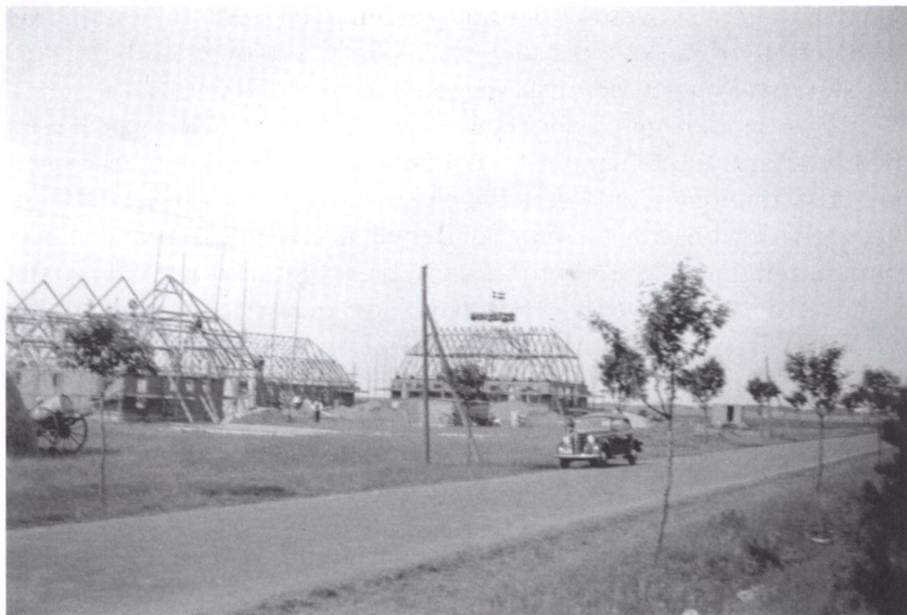
Rejsegilde på Jyndevad Forsøgsstation. 1939.