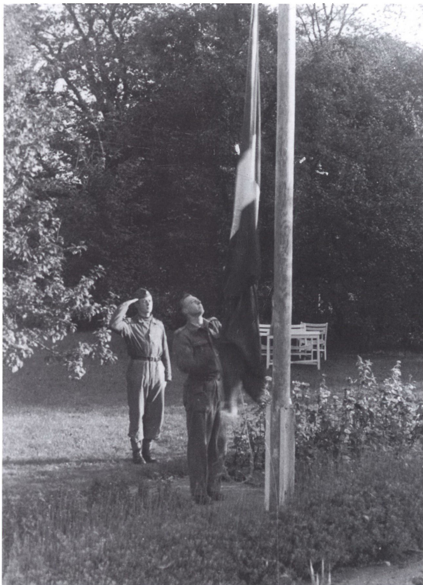
Hver morgen hejste liogarden Dannebrog fra Jydevadhus' flagstang. Juli 1945.

hjemmetyskerne i Jydevad genoptog deres forsamlingshus (det var blevet beslaglagt af de gardersoldater, der kom efter brigadesol-