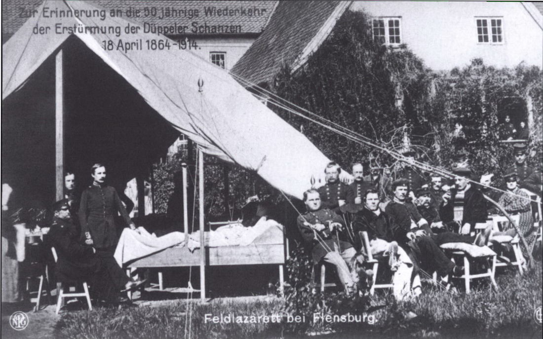
Feldlazarett bei Flensburg.

Zur Erinnerung an die 50 jährige Wiederkehr der Erstürmung der Düppeler Schanzen 18 April 1864-1914.