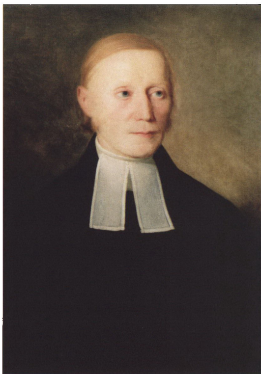
Theodor Fliedner, 1800–1864, grundlægger af diakonissebevægelsen i nyere tid.

Man skal frem til 1830'erne, før en bølge af social interesse gik over de europæiske lande, og samtidig opstod store religiøse vækkelsesbevægelser. I teologiske kredse så man, at den reformerte kirkes diakoni var blevet svag, og i Tyskland havde teologer længe slået til lyd for en genskabelse af de ældste kristne menigheders diakonissearbejde. Her arbejdede kvinder som menighedens tjenerinder og som hjemme-sygeplejersker. Formålet med arbejdet var at forkynde det kristne evangelium gennem et håndens arbejde, og deres »gerningmission« gik hånd i hånd med den »ordmission«, som apostlene udøvede. Diakonisserne i den kristne oldkirke fik deres største udbredelse i det østromerske rige og var gennem deres udførelse af sygepleje og social forsorg med til at udbrede det kristne budskab i de første fire århun-