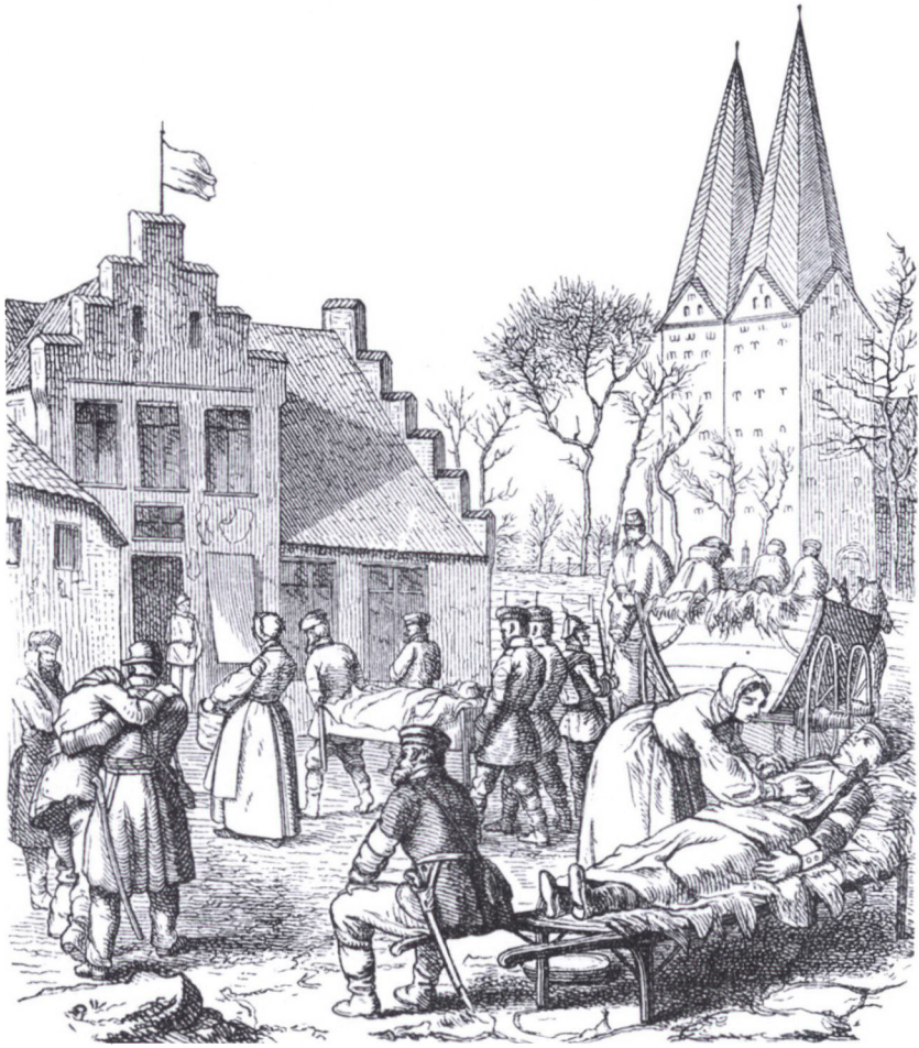
Krigslazaret i Broager. Diakonisse er med til at modtage sårede. Diakonissens sygepleje er holistisk, omfatter både legeme og sjæl. Stik fra Jubilæumsskrift for Kaiserswerth-Stiftelsen 1886.