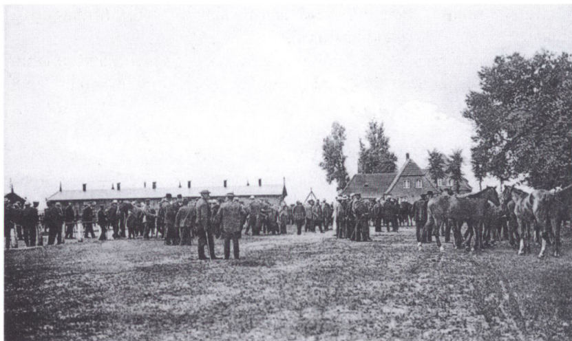
Kvægmarkedsplads i Tønder fra tysk tid. Modstanden mod tvangsafleveringerne af kvæg til Viehhandelsverein var stærk i Tønder kreds under krigen, udtrykt ved oprettelsen af protestbevægelsen Schleswig-Holsteinischer Bauernverein. Kvægafleveringerne til Folkeforsyningsrådet under CIS blev heller ikke uden videre accepteret på Tønderegnen.