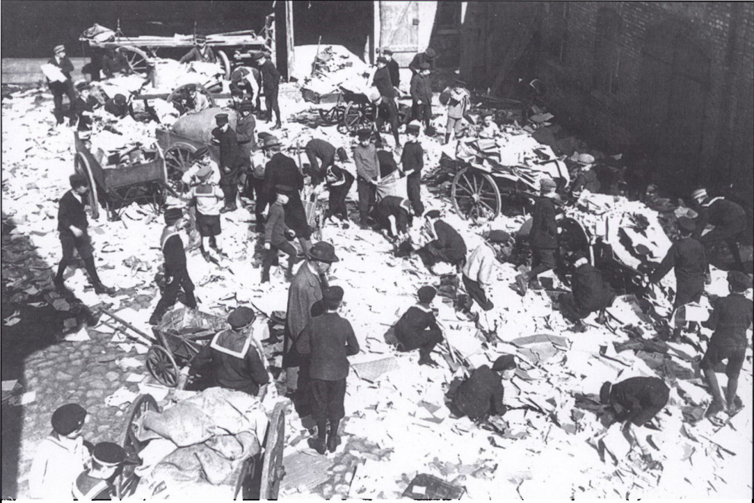
Papirindsamling i Flensborg 1917. I 1917 blev mangelsituationen i Tyskland alvorlig og erstatningsvarer af enhver art dukkede op i handelen. Blandt andet blev papir anvendt som beklædning af mangel på tekstiler, hvorfor der fandt papirindsamlinger sted i Flensborg.

tober 1918 stillede krav om en løsning af det slesvigske spørgsmål på grundlag af den nationale selvbestemmelsesret i den tyske rigsdag. Nønlende godkendte den tyske udenrigsminister Solf dette krav overfor H. P. Hanssen den 14. november. 16.-17. november afholdt den nordslesvigske vælgerforening tilsynsrådsmøde på Folkehjem i Aabenraa, hvor et stort flertal stod bag ønsket om en folkeafstemning i Nordslesvig med en grænse syd om Tønder og nord om Flensborg og med mulighed for sognevis afstemning syd for denne linie. Gennem den danske regering blev det slesvigske spørgsmål herefter rejst overfor ententemagterne på fredskonferencen i Paris i foråret 1919. 9 Slesvig var dermed gået ind i en statsretslig overgangsperiode.