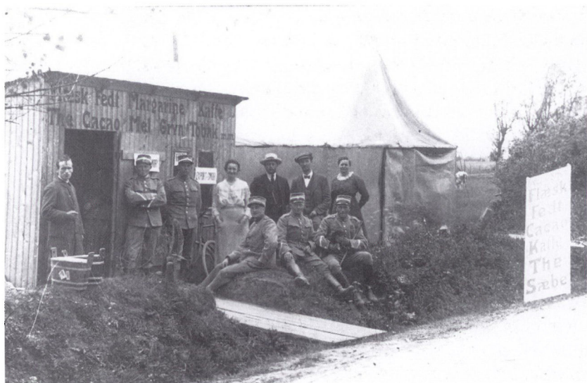
»Grænsekiosk« ved Bajstrup, Kongeågrænsen 1919. Nord for Kongeågrænsen fandt sønderjyderne alle de varer, der var utilgængelige i Tyskland. I 1918-19 tog grænsetrafikken til, og egentlige grænsekiosker blev etableret som her i Bajstrup.

Samtidig gav Nordslesvigs forventede overgang til dansk styre anledning til betydelig økonomisk spekulation. I foråret 1919 oplevede Nordslesvig en invasion af tyskere og tyske firmaer. Fra 1. januar til 1. oktober 1919 etablerede 65 firmaer sig i Haderslev by, heraf kun 5 danske. Omkring 4.000 nye tilflyttere pressede ejendomspriser i vejret. I Aabenraa var 40 nye firmaer tilmeldt handelsregistret i perioden fra 1. oktober 1918 til 1. juli 1919, i Sønderborg 32. Indlån i de Nordslesvigske banker steg fra 132 millioner mark i december 1918 til 287 millioner mark i december 1919. 12 Det var tysk kapitalflugt fra finansminister Erzbergers skatteprogram og spekulation i den kommende valutaregulering, der her sås udfoldet. Samtidig tog trafikken over den nordlige grænse til Danmark til. For 10 pfenning kunne personer, der boede nær grænsen, købe endagspas til Danmark. Det blev udnyttet til at gøre store indkøb af ellers utilgængelige varer, som efterfølgende kunne sælges med god fortjeneste i Nordslesvig. Dertil kom, at mange nordslesvigere optog kronelån i Danmark, for med den værdifulde kronemønt at afløse deres gæld i tyske mark. Der blev optaget lån på den konto for omtrent 60 millioner kroner i 1919. 13