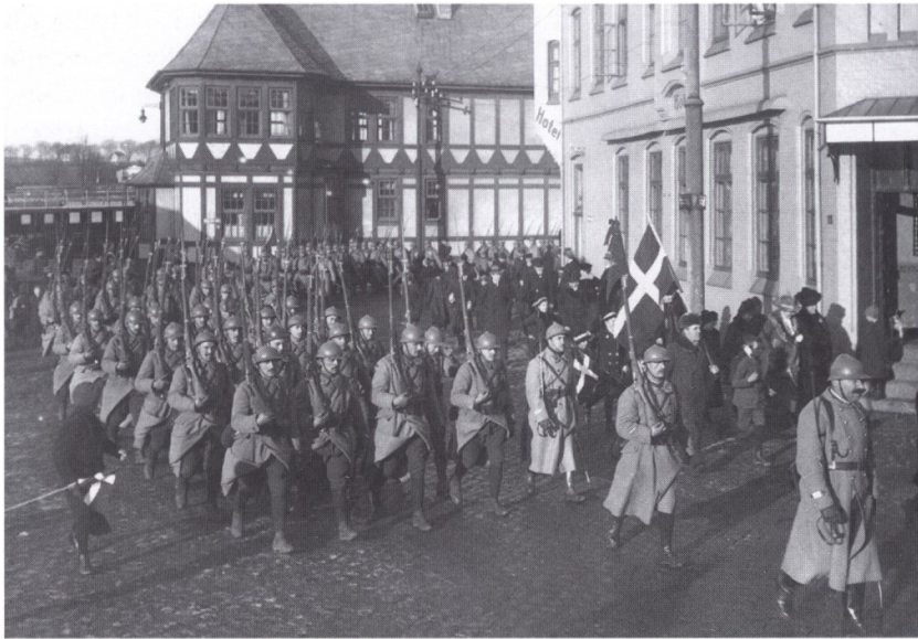
Franske alpejægere på march i Sønderborg. En international besættelsesstyrke bestående af 3000 soldater fra Frankrig og England skulle give synligt bevis for afstemningsområdets internationale status og var mest af symbolsk værdi. Poliitiopgaver og paskontrollen ved afstemningsområdets grænser blev derimod varetaget af et hjælpepolitikorps bestående af tidligere tyske soldater med dansk sindelag.

CIS, tilsynsrådet og den danske regering blev tre modeller diskuteret. CIS kunne rekvirere kornet hos de slesvigske landmænd uden at love efterbetaling, hvilket var den tyske regerings ønske. CIS kunne også aftale efterbetalingsordningen med den danske regering alene og siden kræve den tyske regering til regnskab for halvdelen af omkostningerne. En tredje mulighed var, at CIS købte korn ved den danske regering til forsyning af de forsørgelsesberettigede i afstemningsområdet. Prisen skulle være i overensstemmelse med de eksisterende maksimalpriser og det tab, den danske regering herved fik, senere deles ligeligt mellem Danmark og Tyskland. CIS valgte den sidste løsning, og straks derefter blev der sendt 6.380 hkg. rugmel og 3.170 hkg. hvedemel fra danske kornlagre til afstemningsområdet svarende til 14 dages forbrug. 43 Beslutningen blev truffet udenom den tyske regerings repræsentant og statskommissær Köster.