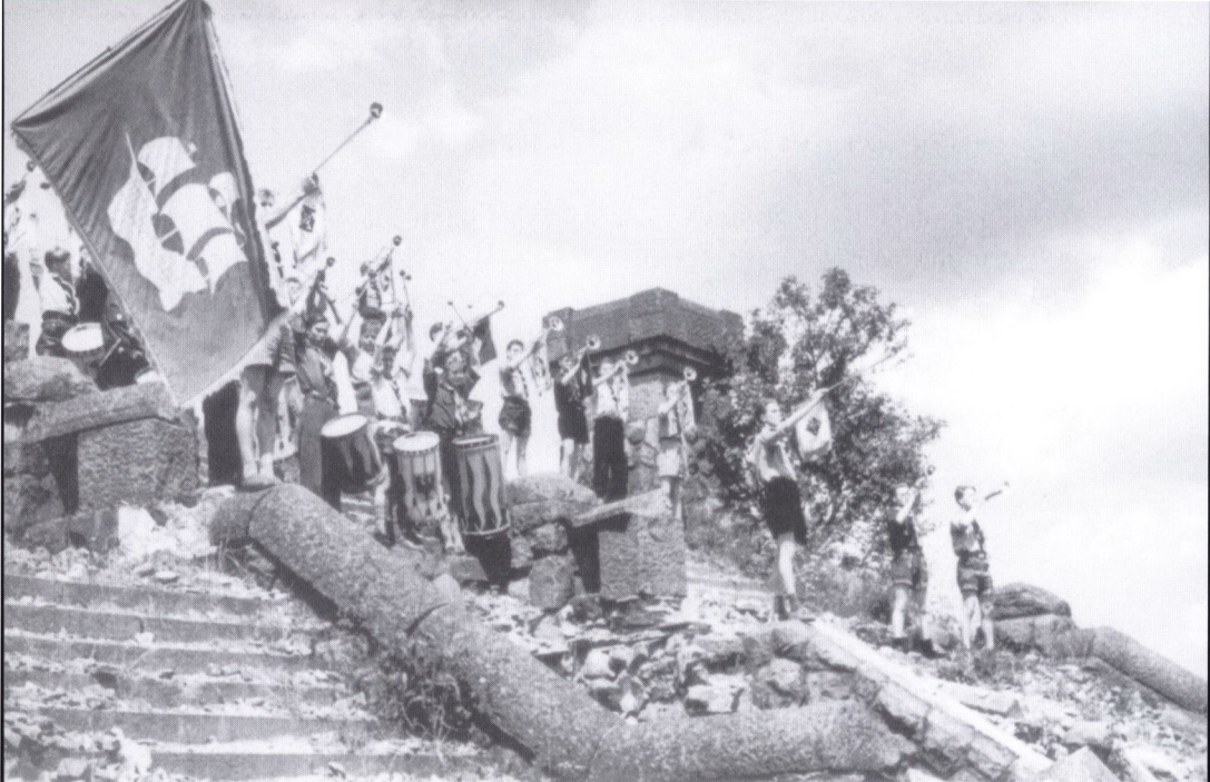
Hjemmetysk ungdom ved det bortsprængte Knivsbjergmonument. Formentlig sommeren 1948. Deutscher Jugendverband für Nordschleswig stiftedes i februar 1948 og var i modsætning til ungdomsforbundet under den nationalsocialistiske epoke dannet på et upolitisk grundlag.