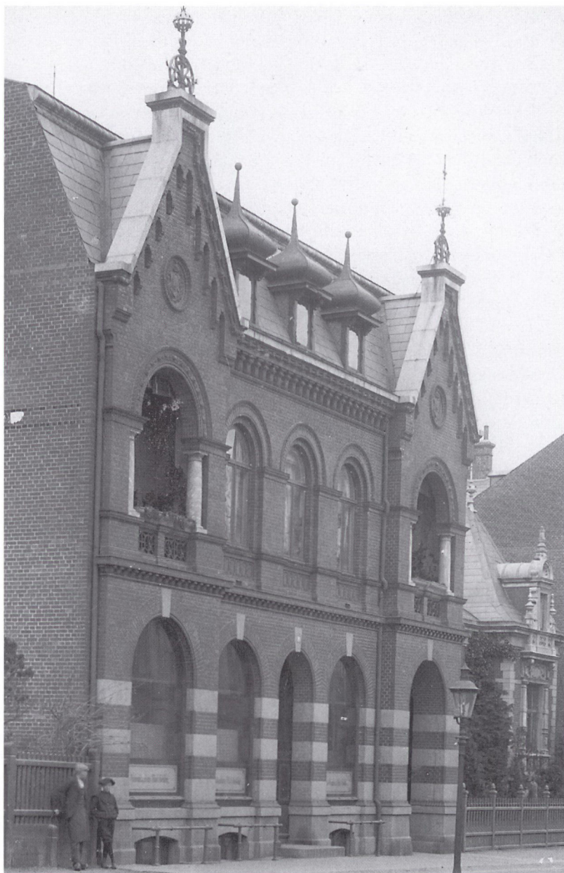
Nationalbankens filial i Kolding. Her samlede Nationalbanken samtlige mønter og sedler til indførelse i Nordslesvig i dagene før den 20. maj 1920. Bygningen er i dag nyrenoveret og huser blandt andet det svenske konsulat. Foto 1920 i Kolding Stadsarkiv.