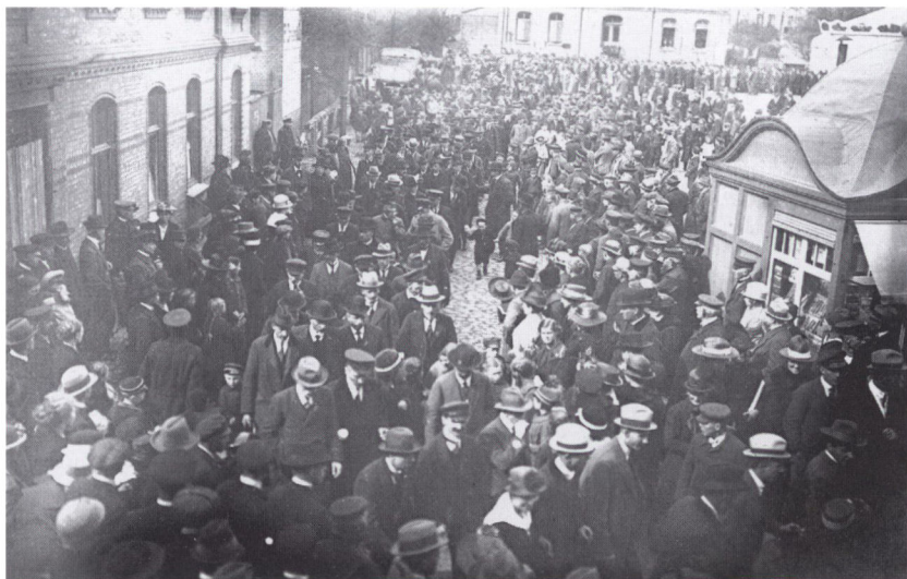
Generalstrejke i juni 1920 på Gravene i Haderslev. Da kronemønten blev indført den 20. maj 1920 steg priserne efterfølgende eksplosivt. I de fire store nordslesvigske byer afholdt arbejderne generalstrejker i første halvdel af juni måned, med krav om tilsvarende lønstigninger. På selve indlemmelsesdagen den 15. juni 1920 blev generalstrejkerne afblæst.

den 5. til den 15. juni. For at holde gas- og elektricitetsværkerne i gang måtte en nødtørftig »samfundshjælp« etableres, hvor en række håndværksmestre holdt gang i disse for samfundet mest nødvendige funktioner. Først den 12. juni lykkedes det at opnå et forlig med arbejderne. Med H.P. Hanssens medvirken blev der opnået enighed om en timeløn efter den i Danmark gældende for hvert fag, og samtidig skulle arbejdsgiverne sørge for, at priserne blev holdt på samme niveau som i Danmark. Til gengæld skulle arbejdet genoptages tirsdag den 15. juni om morgenen. 62 Herefter tilpassede priserne sig langsomt det danske niveau, og roen blev genoprettet i Nordslesvig. Det hang også sammen med, at den nye grænse blev notificeret samme dag, tirsdag den 15. juni 1920. Dermed ophørte den tyske suverænitæt over Nordslesvig, og toldgrænsen kunne endelig flyttes til 1. zones sydgrænse. Natten mellem den 16. og 17. juni forsvandt de tyske toldere ved Kongeågrænsen, og den 17. juni påbegyndte både det danske og det tyske toldvæsen deres opgaver ved den nye grænse. Endnu et stykke tid opretholdt den danske regering kontrollen ved Kongeåen for at forhindre storstilet toldfri vareindførsel fra Nordslesvig til Dan-