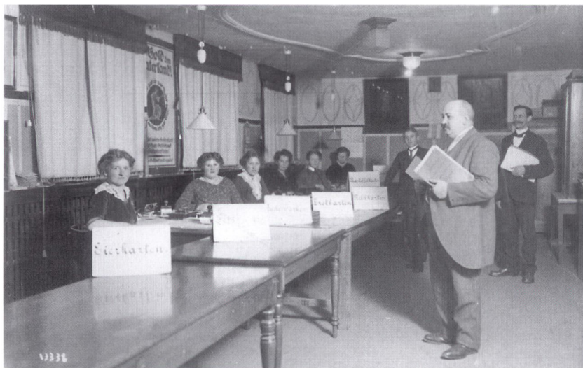
Rationeringskortudlevering på Haderslev Rådhus omkring 1917. Rationeringskortene var en følge af vareknapheden under 1. verdenskrig. Læg mærke til plakaten i midten, »Gold dem Vaterland«, en opfordring til borgerne om at indlevere guld til rigsbanken. Den tyske rigsbank lod seddelpressen rulle under krigen. Seddeludstedelsen blev finansieret ved krigslånsobligationer og borgernes indlevering af guld- og sølvmonter. Den politik var en af hovedårsagerne til at inflationen løb ud af kontrol.

det hele taget uden den store politiske betydning i Nordslesvig, hvor det først og fremmest var grænsespørgsmålet, der optog sindene. Soldater- og arbejderrådernes arbejde lå i demobiliseringen og fødevareforsyningen lokalt. En række kontrolopgaver havde rådene også, blandt andet kontrol af at den nyindførte otte-timers arbejdsdag blev overholdt og af den almindelige administration. 13