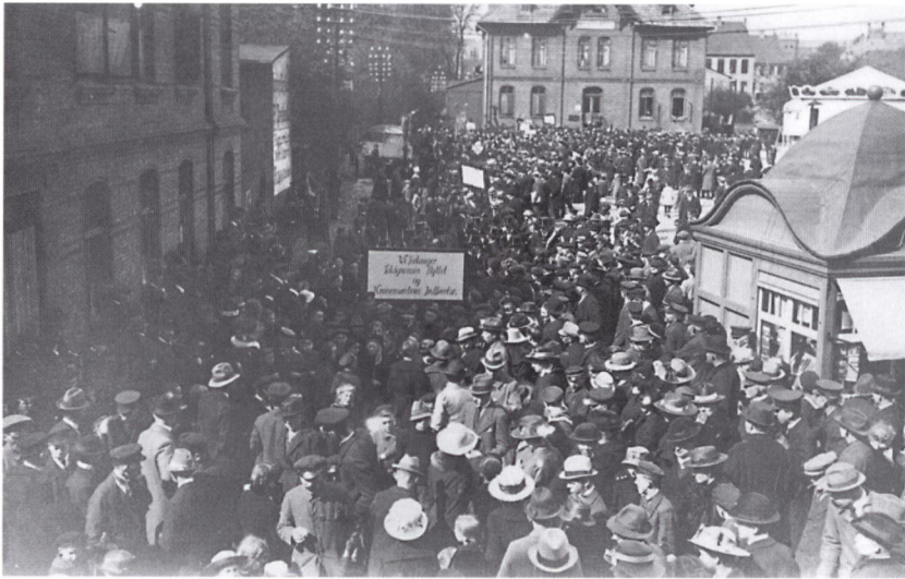
Demonstration på Gravene i Haderslev omkring april-maj 1920 for kronemøntens indførelse. Den slags demonstrationer var hverdagskost i Nordslesvig i foråret 1920.

der længe havde været primært hos de grupper, der havde arbejdet med valutaspørgsmålet i Danmark. Den økonomiske støtte fra den danske stat skulle være præcist rettet mod de mest trængende og hurtig overstået. Økonomien og erhvervslivet i Nordslesvig skulle hurtigst muligt kunne overlades til sig selv.