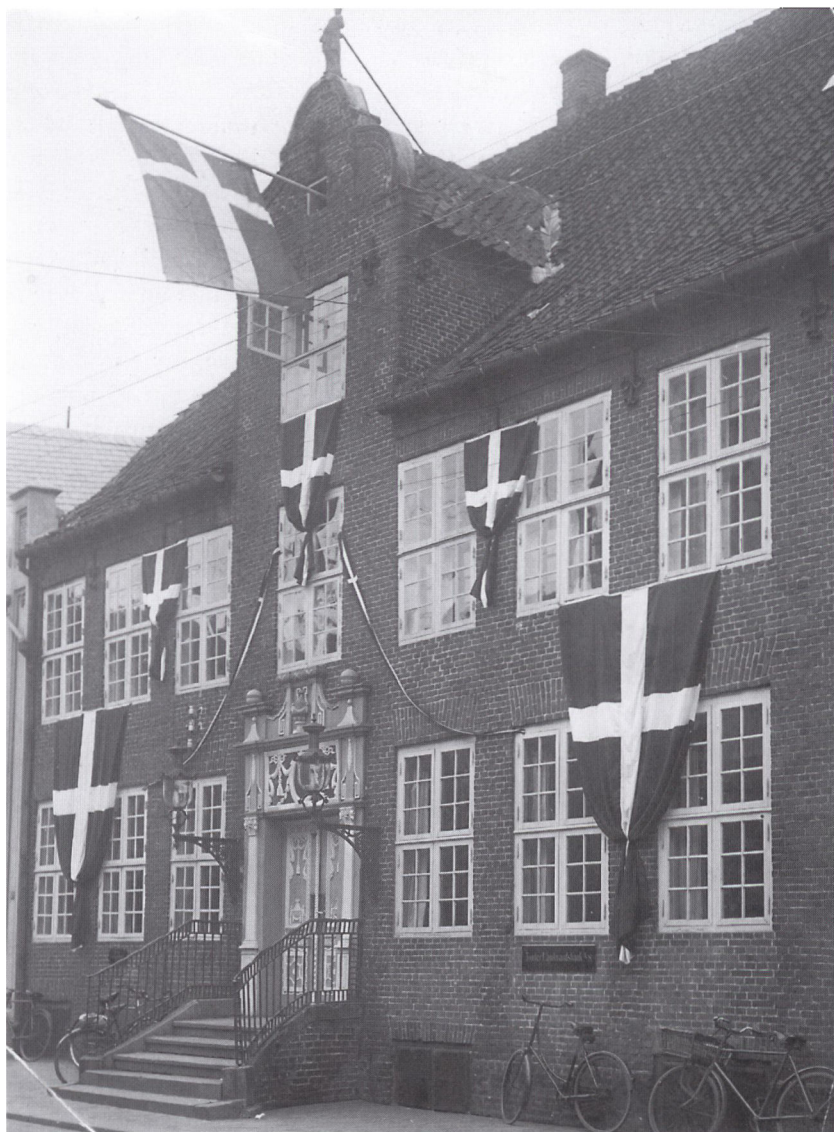
Tønder Landmandsbank angiveligt den 12. juli 1920, da Christian X red ind i byen. Tønder Landmandsbank, en af de fire store nordslesvigske banker, blev stiftet den 30. september 1901. Den 15. juli 1970 fusionerede banken med Den Nordslesvigske Folkebank, Graasten Bank og Folkebanken for Als og Sundeved til Sydbank.