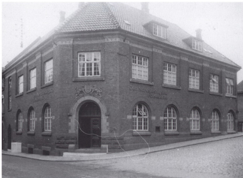
Den Nordslesvigske Folkebank, Aabenraa omkring 1920. Nordslesvigsk Folkebank blev stiftet i 1872. I 1970 tog banken initiativ til Sydbankfusionen med Graasten Bank, Folkebanken for Als og Sundeved og Tønder Landmandsbank.

regeringers repræsentanter og den internationale kommission fandt grev Reventlow fra det danske udenrigsministerium en løsning. I stedet for at flytte toldgrænsen kunne grænsen mellem 1. og 2. zone afspærres. Den løsning kunne den internationale kommission tilslutte sig, og vejen var dermed banet for kronemøntens indførelse. Den 29. april underskrev generalsekretæren for kommissionen, Brudenell-Bruce, og den danske regerings repræsentant, amtmand Lundbye, en aftale om dansk besættelse af 1. zone og en afspærring af grænsen mellem 1. og 2. zone den 5. maj 1920. Med besættelsen den 5. maj overtog Danmark administrationen af 1. zone.