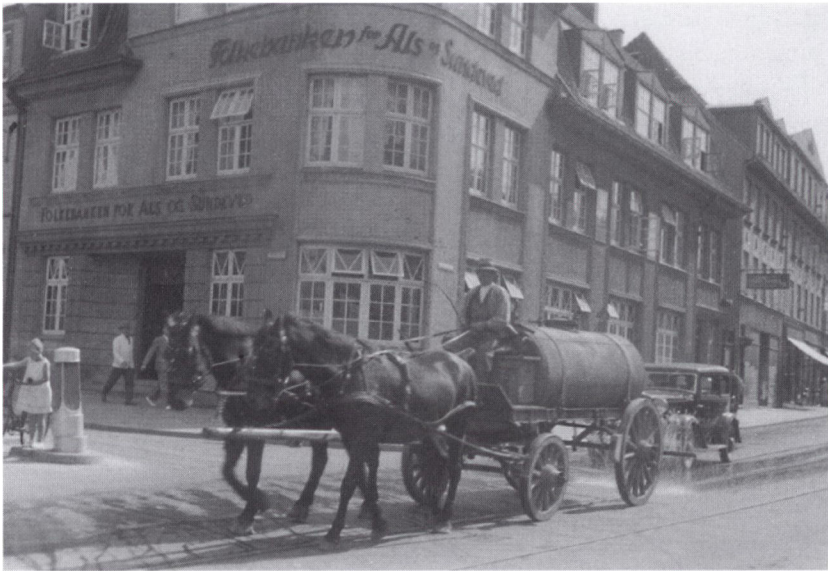
Folkebanken for Als og Sundeveds bygning i Sønderborg omkring 1930-35. Folkebanken blev stiftet i 1909. Fusionerede med Graasten Bank, Nordslesvigsk Folkebank og Tønder Landmandsbank i 1970.

derfor efterhånden ret i, at der ikke længere kunne tages udgangspunkt i forholdet mellem kreditorer og debitorer. Samtidig satte et dramatisk fald i markkursen ind i efteråret 1919, jævnfør tabel 1. Jo mere markkursen faldt, jo dyrere ville en kursregulering til fredskurs blive for den danske stat. Det var en væsentlig årsag til, at chancen for en omveksling til fredskurs blev mindre og mindre.