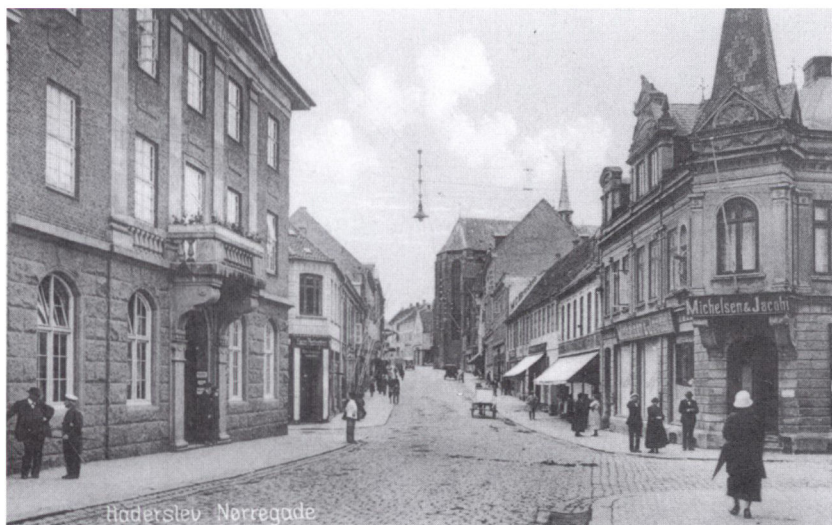
Haderslev Bank og Nørregade i Haderslev omkring 1920-25. På venstre side ses Haderslev Banks bygning Nørregade 30 indviet i 1916. Haderslev Bank, en af de fire store nordslesvigske banker i 1920, blev grundlagt i 1875. I 1969 fusionerede Haderslev Bank med Privatbanken, i dag Nordeabank. Postkort 1920-25 i Haderslev Byhistoriske Arkiv.

ret bestikkelige. Personlige forbindelser var afgørende. Der har derfor været store individuelle forskelle på, hvorledes landbruget kom igennem krigen fra brug til brug. 9