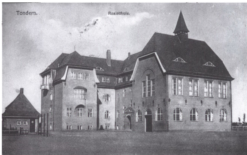
Postkort med Tønder Statsskoles bygninger, som de så ud ved overdragelsen. Den 25. august 1920 åbnede skolen som dansk statsskole. Ved åbningen var der 88 elever. Først ved en overenskomst af 15. oktober 1920 blev bygningerne formelt overdraget fra Tønder Kommune til den danske stat.

sønderjyske Ministerium en særdeles alsidig repræsentation for danskheden i det vestlige Nordslesvig. 38