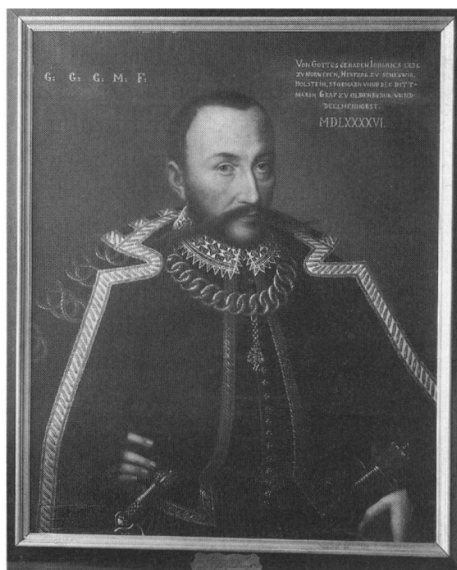
Hans den Yngre (1545-1622), hertug af Slesvig-Holsten-Sønderborg, blev stamfader til de mange sønderborgske hertuginjer. Her ses han afbildet på et maleri fra 1596, der hænger på Glücksborg Slot. Forkortelsen G.G.G.M.F. står for det fromme ønske: Gott gebe Glück mit Frieden.

benyttes på Rigsarkivet. En betydelig del af dem foreligger imidlertid trykt. Det gælder navnlig pergamentene fra de ældste hertugers tid.