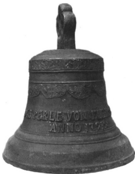
Skibsklokken, der blev fundet ved Tenerife.

over i et andet skib, der så er forlist ved Tenerife? Hvis der er tale om, at skibet er forlist med mand og mus, så har der ikke været overlevende, der kunne berette om det nøjagtige sted for forliset. Men i dette tilfælde ved vi, at i hvert fald kaptajnen har overlevet.