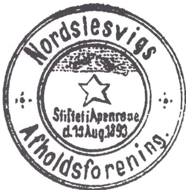
Stempel for Nordslesvigs Afholdsforening, stiftet 13. august 1893. Landsarkivet i Aabenraa, Aabenraa landsrådsarkiv K.A.2. 1894.