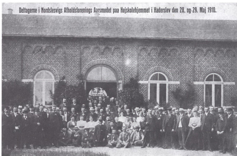
Postkort med deltagerne i Nordslesvigs Afholdsforenings årsmøde i Haderslev i 1910. På dette tidspunkt var foreningen i god vækst, og der var mødt 43 foreningsdelegerede op til årsmødet. Det offentlige møde på årsmødets andendag var ifølge »Nordslesvigs Afholdsblad« »besøgt af rigelig 200 Personer«. Postkort i Institut for sønderjysk Lokalhistorie.

sig anstrengelser for at samle alle om en folkeadresse. Gotthardsen argumenterede: »en Folkeadresse, er det største, vi kan yde, det er at slå et Hovedslag og inden vi går dertil, maa Jordbunden forberedes«. Stor Templaren lovede at tage disse betragtninger og forslaget om en deltagelse i henvendelsen til kredsudvalgene med til storlogemødet i Graasten i august 1910.