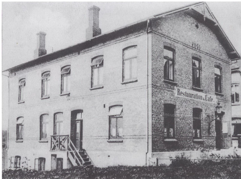
I.O.G.T. logethuset i Aabenraa. I de større nordslesvigske byer oprettedes der ofte flere I.O.G.T.-loger, og behovet for mødesteder, der kunne stå med permanent indrettede logelokaler, gjorde, at der nogle steder blev investeret i logebygninger. Således f.eks. i Aabenraa, hvor lokalet lå i Forstallé 11.

alkoholgrænse man kunne acceptere. Der var derfor ikke en fælles, afklaret holdning til ølspørgsmålet.