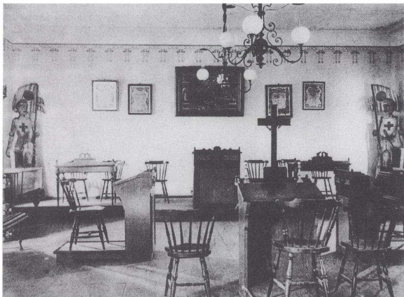
De fastlagte ceremonier i I.O.G.T.-logerne fordrede en ganske bestemt logeindretning, hvor embedsmænd og menige medlemmer havde deres helt fastlagte positioner i forhold til hinanden. I småbyer, hvor logerne var små, indrettedes måske en dagligstue eller et forsamlingshuslokale fra møde til møde, mens man i de byer, hvor man fik oprettet logebygninger, kunne lade lokalerne stå permanent. Her fra I.O.G.T.-bygningen i Aabenraa.

at indgå et kompromis der tillod den svage øl, men forbød dobbelt- og bitterøllen.