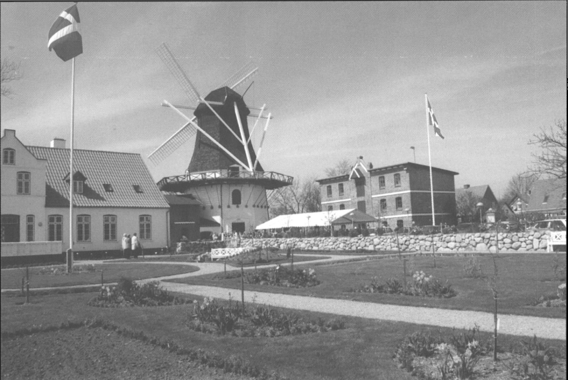
Indvielsen af Højer Møllehave 2. maj 1997. Selve indvielsen fandt sted under den lyse teltduk på møllepladsen.

Peder Aarslevs Legat i samme periode yder 50.000 kr. årligt til driften. Desuden skænkede Peder Aarslevs Legat i 1997 200.000 kr. til indkøb af tolv gulvmontrer til husets møblering som museumshus.