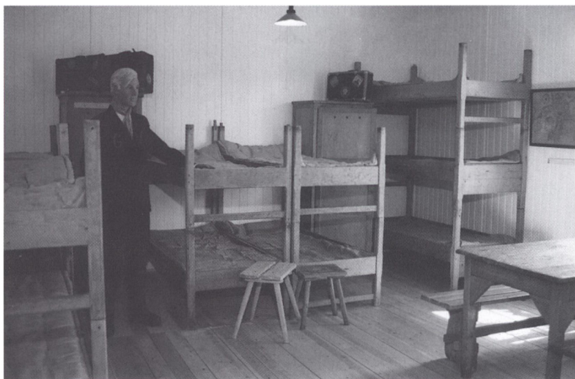
Fangestuen i den fredede og renoverede barak H4 i Frøslevlejren.

mum for det årlige pristalsregulerede beløb, Dansk Røde Kors kunne bidrage med. Denne beløbsgrænse er nu overskredet.