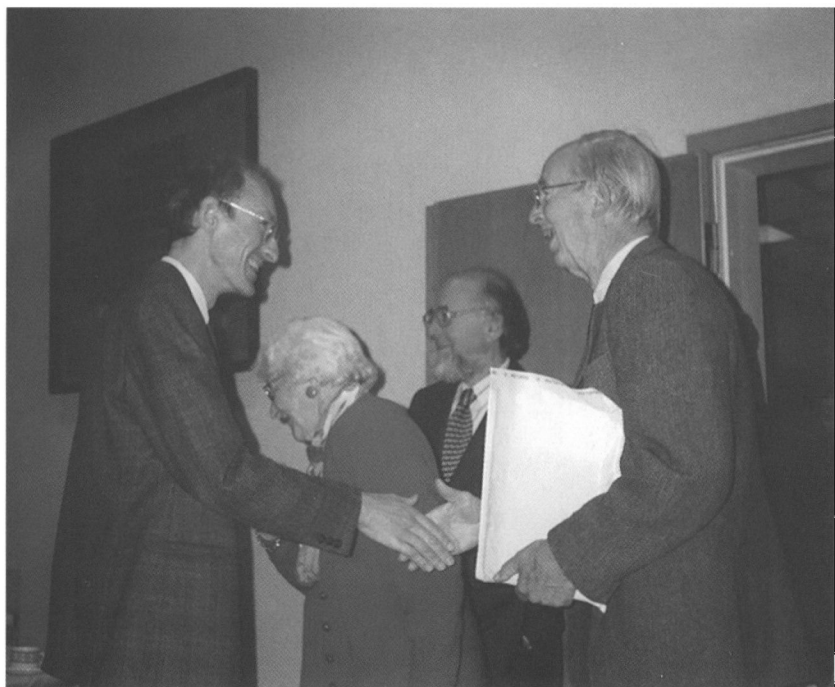
Jubilæumsdagen 1. november 1997: Formanden byder velkommen før eftermiddagens foredrag.