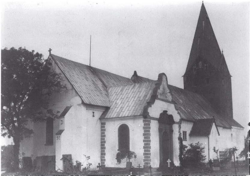
Møgeltønder kirke set fra nord-vest. Begge tilbygninger var reserveret grevefamilien. Forrest ses det Schackske kapel og bag dette den murede opgang til det grevelige pulpitur.