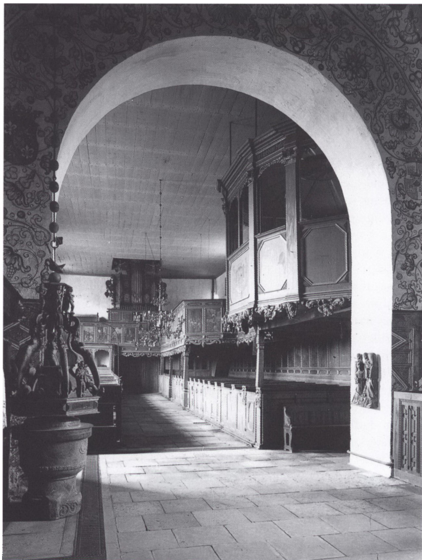
Møgeltønder kirke set fra koret. Forrest på nordvæggen ses det grevelige pulpitur. Prædikestolen var placeret direkte overfor (her skjult af korbuen). Umiddelbart bag det grevelige pulpitur (på samme væg som dette) ses det nye pulpitur. På endevæggen sad det gamle pulpitur, hvorpå også orgelet var anbragt. Det var bygget før Schackenburgs oprettelse, og pladserne her var billige. På det nye pulpitur tronedede efter 1692 sognets ledende mænd med greveparret i spidsen. Kvinderne og bolsfolkene måtte nøjes med pladserne på kirkens gulv.