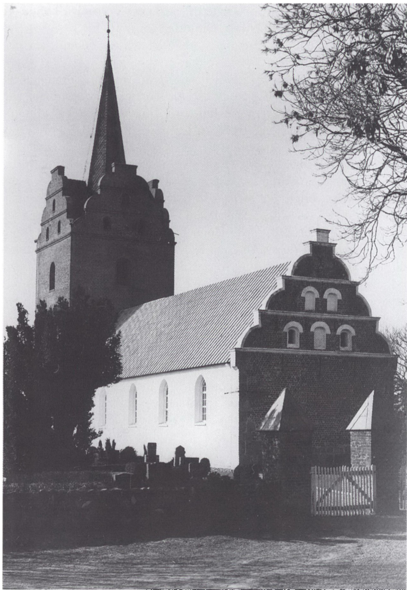
Visby kirke set fra syd-øst. Rantzaus ombygning omkring 1590 satte afgørende præg på kirken, der bl.a blev forsynet med svungne renæssance-gavle. Tårnet blev ved ombygningen forsynet med et højt og prangende spir med en dristig søjlekonstruktion og forgyldt blik på taget. Spiret blev dog siden erstattet med et mindre og mere holdbart.