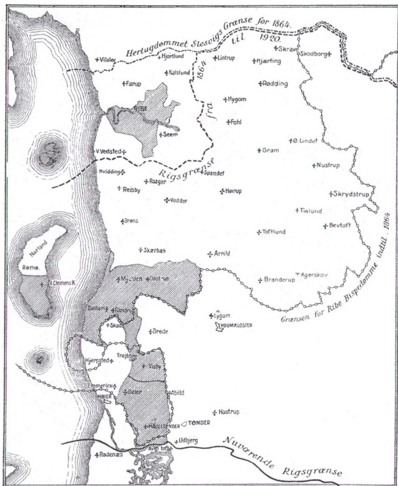
De kongerigske enklaver før 1864 (det skraverede). Foruden de på kortet afbildede områder omfattede enklaverne også den nordlige del af Sild (List), Vesterlandfjor og Amrum. Gengivet efter Trap: De sønderjyske Landsdele , 1929.

deres dele. De adelige godser lå under fællesstyre. Både i de kongelige og hertugelige dele af Slesvig forblev patronatsretten hos landsherren. »Privatiseringen« af kirkerne må siges at have været en enestående dansk specialitet, og det kan derfor ikke undre, at de gottorpske hertuger og Hans d. Ældre ikke efterlignede denne. 7 Anderledes