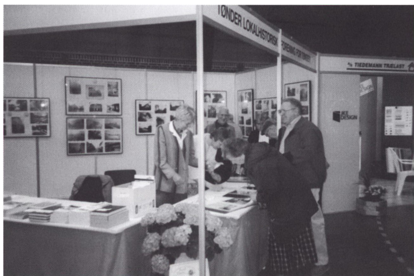
Lokalhistorisk Arkiv i Tønder havde stor succes med en stand på Tønder messe den 20.-21. april 1996. På standen udstillede man fotograf Schwennesens tønderbilleder fra ca. 1900 til 1955. Her kunne de besøgende også bestille kopier af billederne.

fra Tonhalle-Foto. Sidstnævnte er bl.a. pressefotos fra begivenheder i hele det gamle Tønder Amt ca. 1955-90.