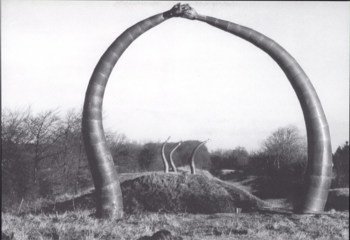
Et usædvanligt syn på Danevirke. Kunstfærdigt udskårne hænder i træ sat på arme af kobber giver hinanden et håndslag på Hovedvolden ved Kurborg. Disse arme og hænder udgjorde hovedelementet i en udendørs kunstudstilling på Danevirke i begyndelsen af december 1996.

forhold til deres besøg og oplevelse (hhv. mangel på samme). Således skrev en række skoleelever samstemmende efter hinanden i gæstebogen: »Jeg synes det er godt her. Det er lidt kedeligt«. Og dét udsagn kan det jo være svært at forholde sig til. Men det er taget til efterretning.