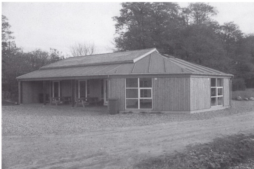
Udstillingshuset i Gram lergrav, åbnet 31. august 1996.

side, ikke mindst en række frivillige hjælpere fra Lokalhistorisk Arkiv for Gram og Omegn, samt fra medlemmer af Midtsønderjyllands Museumsforening, lykkedes det at færdiggøre huset til den officielle åbning på sommerens sidste dag d. 31. august.