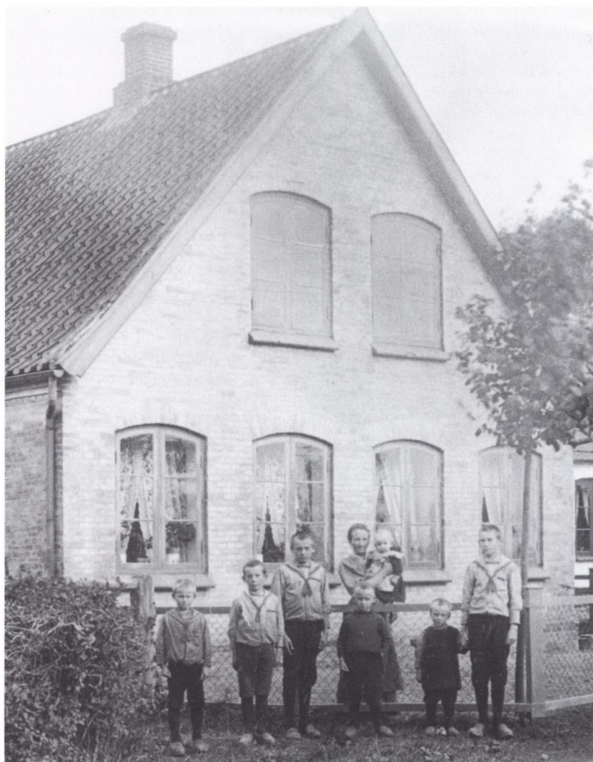
En skipperkone med sin børneflokk foran familiens hus i Alnor, ca. 1910. De fire største drenge er i ens kadetstribeede matrosbluser, knæbukser og træsko. På den tid var matrostøj blevet allemandseje, som husmødrene let selv kunne sy eller tilpasse, så det kunne gå i arv. Billedet indgik i den alsidige vandreudstilling om matrostøj, som fik premiere på Aabenraa Museum i 1996.